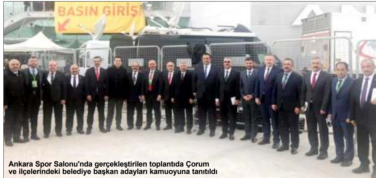
Ankara Spor Salonu'nda gerçekleştirilen toplantıda Çorum ve ilçelerindeki belediye başkan adayları kamuoyuna tanıtıldı

AK Parti'nin AK Parti 31 Mart 2019 Yerel Seçimleri Aday Tanıtım Toplantısı, Ankara Spor Salonu'nda gerçekleştirildi. Cumhurbaşkanı ve AK Parti Genel Başkanı Recep Tayyip Erdoğan'ın da katılımıyla düzenlenen toplantıda Çorum ve ilçelerindeki belediye başkan adayları kamuoyuna tanıtıldı.