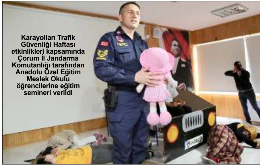
Karayolları Trafik Güvenliği Haftası etkinlikleri kapsamında Çorum İl Jandarma Komutanlığı tarafından Anadolu Özel Eğitim Meslek Okulu öğrencilerine eğitim semineri verildi

Ramazanın anlam ve coşkusunu herkesin yaşayabilmesi dileğiyle, "Hayırlı Ramazanlar..."