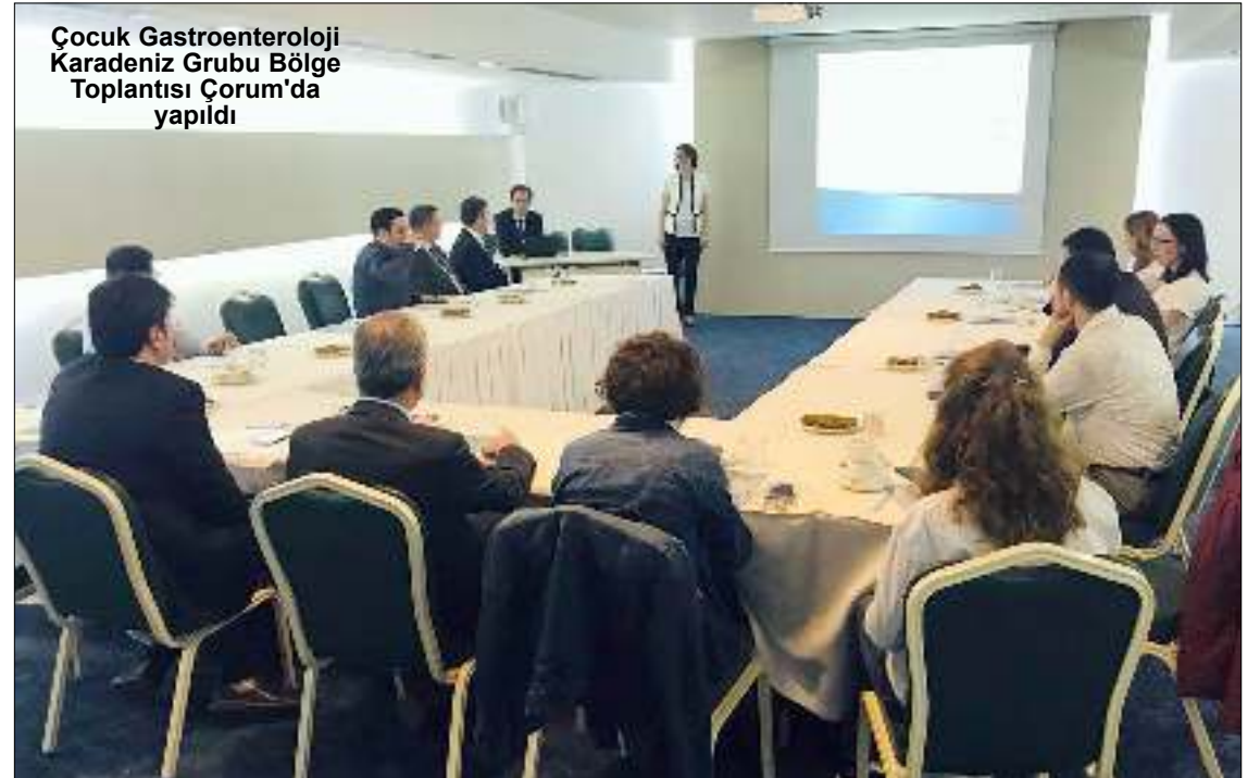
Çocuk Gastroenteroloji Karadeniz Grubu Bölge Toplantısı Çorum'da yapıldı