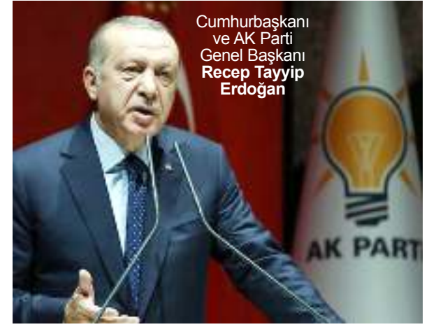
Cumhurbaşkanı ve AK Parti Genel Başkanı Recep Tayyip Erdoğan

Jandarma ekiplerinin bu hareketi köylüler tarafından büyük takdir topladı.