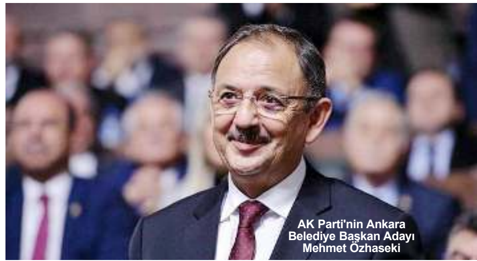
AK Parti'nin Ankara Belediye Başkan Adayı Mehmet Özhaseki

31 Mart'ta yapılacak yerel seçimler kapsamında AK Parti'de Çorum Belediye Başkan Adayının açıklanmasının ardından gözler ilçe belediye başkan adaylarına çevrilmişti. AK Parti'nin Ankara Belediye Başkan Adayı Mehmet Özhaseki, adayları açıklamak için Cumartesi günü Çorum'a gelecek. Gece Çorum'da konaklayacak olan Özhaseki, Pazar günü sabah saatlerinde Atatürk Spor Salonu'nda gerçekleştirilecek programda partinin ilçe belediye başkan adaylarını açıklayacak. 4'DE