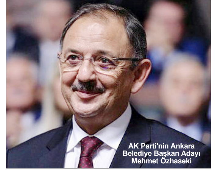
AK Parti'nin Ankara Belediye Başkan Adayı Mehmet Özhaseki

Saat 13:30'da ilçe belediye başkan adaylarıyla yemekte bir araya gelecek olan Mehmet Özhaseki, yemeğin ardından kentten ayrılacak.