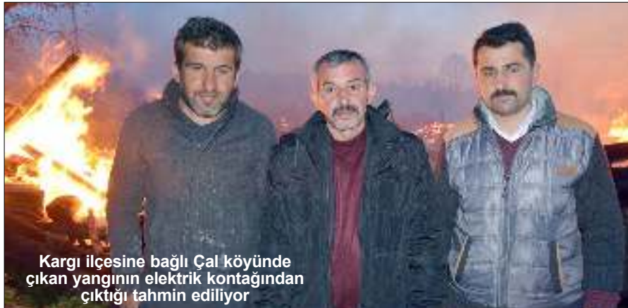
Kargı ilçesine bağlı Çal köyünde çıkan yangının elektrik kontağından çıktığı tahmin ediliyor

Kargı ilçesine bağlı Sinop sınırında bulunan Çal köyünde çıkan yangında 8 ev kül oldu. İlçeye bağlı Çal köyündeki elektrik kontağından çıktığı tahmin edilen yangın kısa sürede büyüdü. Alevler çevredeki evlere sıçradı. İlk müdahaleyi köylülerin kendi imkanlarıyla yaptığı yangına Kargı Orman İşletme Müdürlüğüne ait 2 arazöz, 1 su tankeri, Tosya Orman İşletme Müdürlüğüne ait 2 arazöz, 1 su tankeri, Çorum Orman İşletme Müdürlüğüne ait 1 arazöz, 1 su tankeri ve Osmancık Belediyesine ait 2 İtfaiye aracı ile müdahale etti. Yaklaşık 2 buçuk saatte kontrol altına alınan yangında soğutma çalışmaları sürüyor. 3'DE