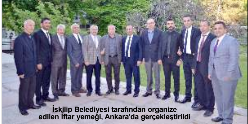
İskilip Belediyesi tarafından organize edilen İftar yemeği, Ankara'da gerçekleştirildi