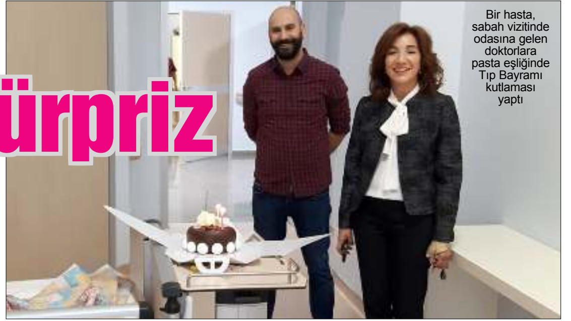
Bir hasta, sabah viziğinde odasına gelen doktorlara pasta eşliğinde Tıp Bayramı kutlaması yaptı