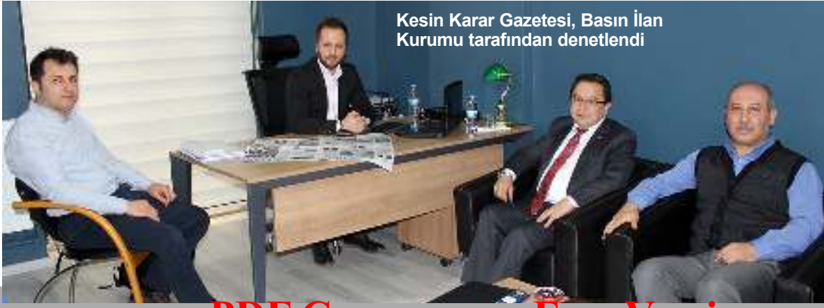
Kesin Karar Gazetesi, Basın İlan Kurumu tarafından denetlendi