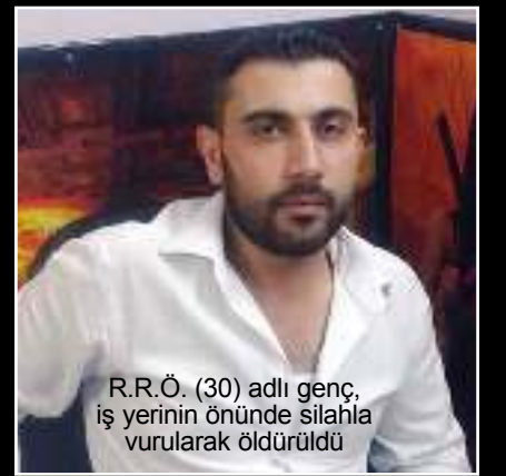
R.R.Ö. (30) adlı genç, iş yerinin önünde silahla vurularak öldürüldü