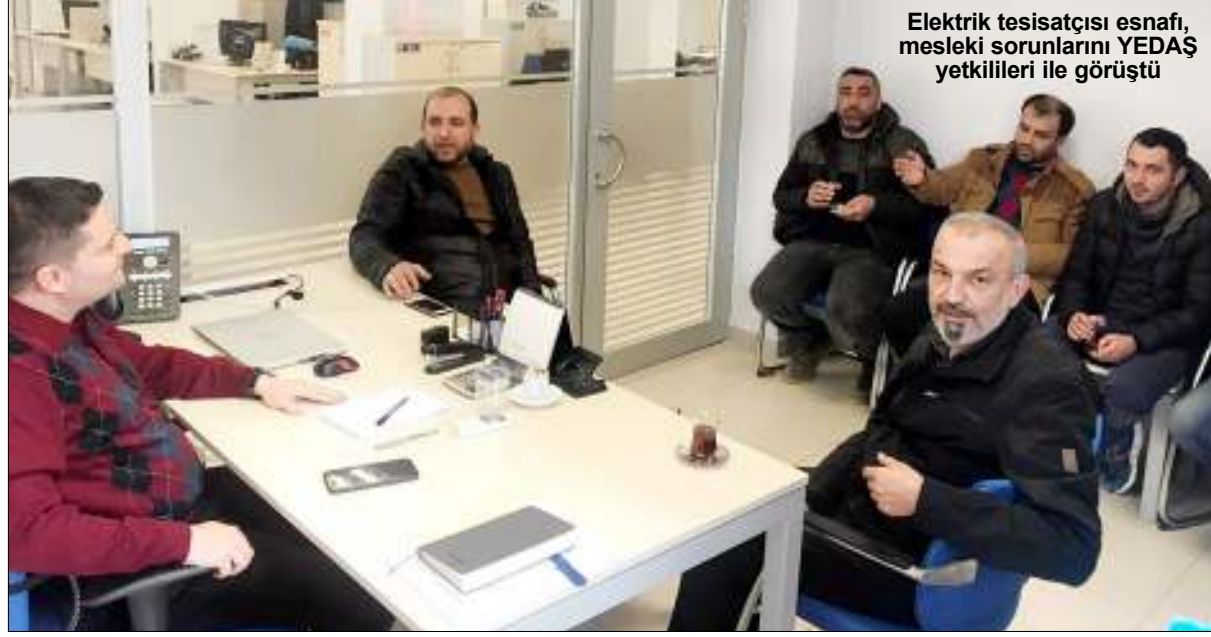
Elektrik tesisatçısı esnafı, mesleki sorunlarını YEDAŞ yetkilileri ile görüştü