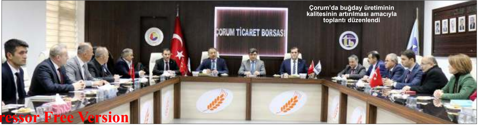
Çorum'da buğday üretiminin kalitesinin artırılması amacıyla toplantı düzenlendi

Evde bakım desteği hizmetinden geçtiğimiz yıl 513 bin 276 kişi faydalandı. Söz konusu hizmete geçen yıl 6,8 milyar lira kaynak aktarıldı. Evde bakım desteğinden yararlanmak için tek şart gelir değil. Bu ödeme için Engelli Sağlık Kurulu raporunda engel oranının yüzde 50 ve üzerinde olarak belirtilmesi, ayrıca 'ağır engelli' ibaresinin yer alması isteniyor. (Haber Merkezi)