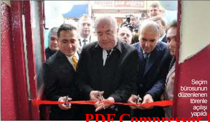
Seçim bürosunun düzenlenen törenle açılışı yapıldı.