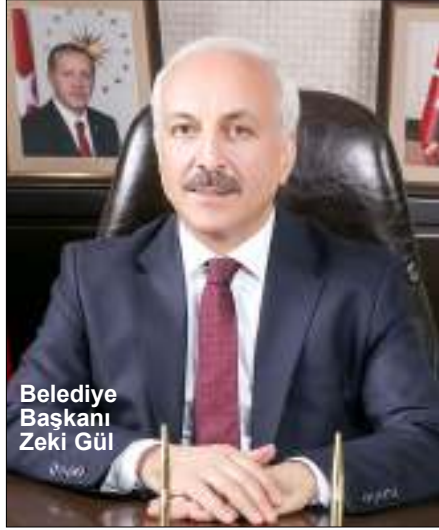
Belediye Başkanı Zeki Gül

Çorum Belediyesi ile Şehit Aileleri Birliği tarafından, Türkiye'nin çeşitli yerlerindeki terör olaylarında yaşamını yitiren kahraman şehitlerimizin kıyafet ve eşyalarından oluşan '21. Şehit Emanetleri Sergisi' 18 Ocak'ta açılacak. Sergi 25 Ocak tarihine kadar açık kalacak.