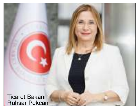
Ticaret Bakanı Ruhsar Pekcan

KOBİ'ler ile kadın ve genç girişimcilerin ihracata dahil olmasını sağlamaya çalışmalarının sürdürüldüğünden bahseden Bakan Pekcan, KOBİ'lerimizin Eximbank olanaklarından yararlanmaları için özel bir strateji geliştirdik ve şuan da Eximbank kredi imkanlarından yararlanan KOBİ'lerin sayısını 11 bin 500'e çıkardık. İnşallah yılsonu hedefimiz 12 bin 500' ifadelerini kullandı. (Haber Merkezi)