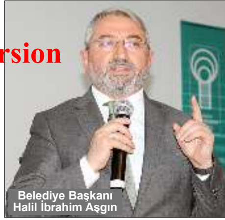
Belediye Başkanı Halil İbrahim Aşgın