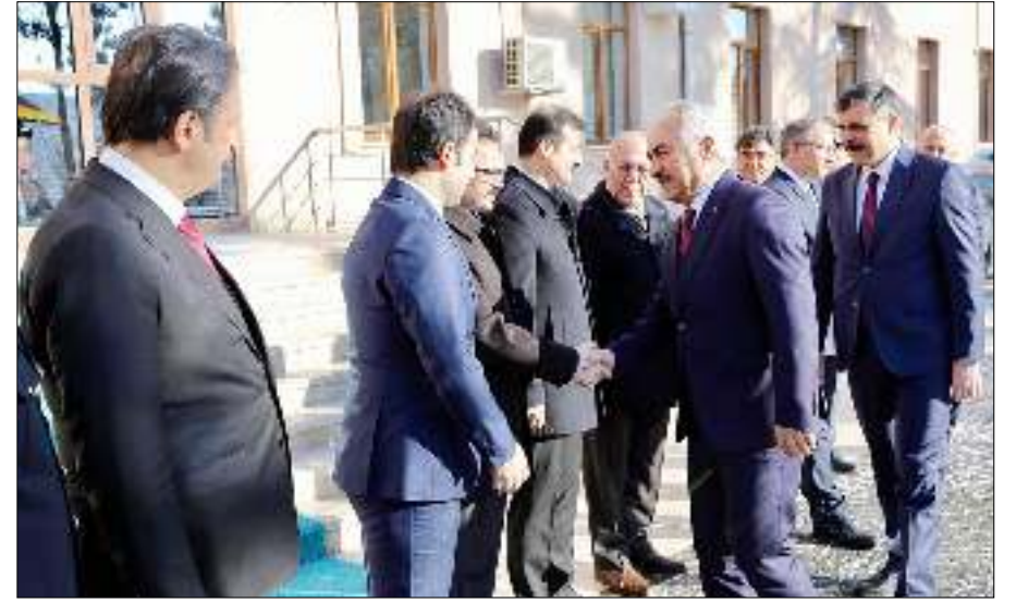
İçişleri Bakan Yardımcısı Mehmet Ersoy'un başkanlığındaki heyet, Çorum'a geldi

Toplantıda Çorum Valisi Mustafa Çiftçi'nin yanı sıra, kentteki kamu kurum ve kuruluşlarının temsilcileri de hazır bulundu. (Çağrı UZUN)