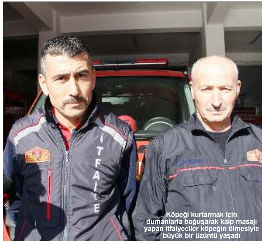
Köpeği kurtarmak için dumanlarla boğuşarak kalp masajı yapan itfaiyeciler köpeğin ölmesiyle büyük bir üzüntü yaşadı

Kendisinin de bir hayvansever olduğunu ve köpeğin öldüğünü duyunca çok üzüldüğünü belirten Özçiftçi, "Burada kedi besliyoruz. Kendimin bir tane köpeği var. Hayvanları çok seviyorum. Aynı yerde bir yavru köpek vardı. Onu da kurtardık. Ona hiç bir şey olmamıştı. Onu da dışarı çıkardık ve sahibine teslim ettik" şeklinde konuştu. (İHA)