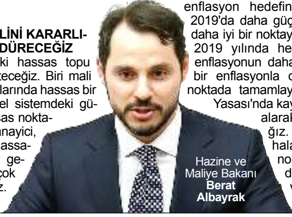
Hazine ve Maliye Bakanı Berat Albayrak

Biz rakamsal kriterlerle performansımızı ortaya koyacağız. Hazine ihaleleri başarıyla gerçekleşti, faizler düştü. Faizi tek haneye düşürmeye kararlılıkla gayret edeceğiz. Enstrüman çeşitliliğini artırmak için Japon yeni cinsinden samuray bono ihracı ile ilgili görüşmelere başladık, bunu da hayata geçireceğiz. Avrupa birinci önceliğimiz olmaya devam edecek. Karşılıklı kazan kazan ilişkisini daha ileriye taşıyacağız." (Haber Merkezi)