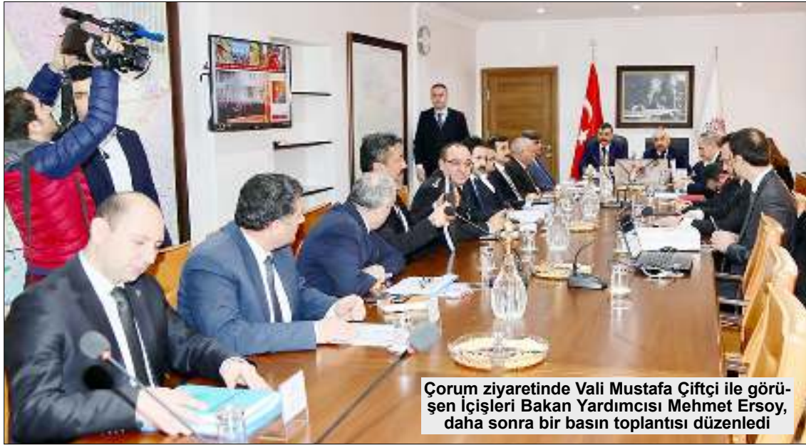
Çorum ziyaretinde Vali Mustafa Çiftçi ile görüşen İçişleri Bakan Yardımcısı Mehmet Ersoy, daha sonra bir basın toplantısı düzenledi