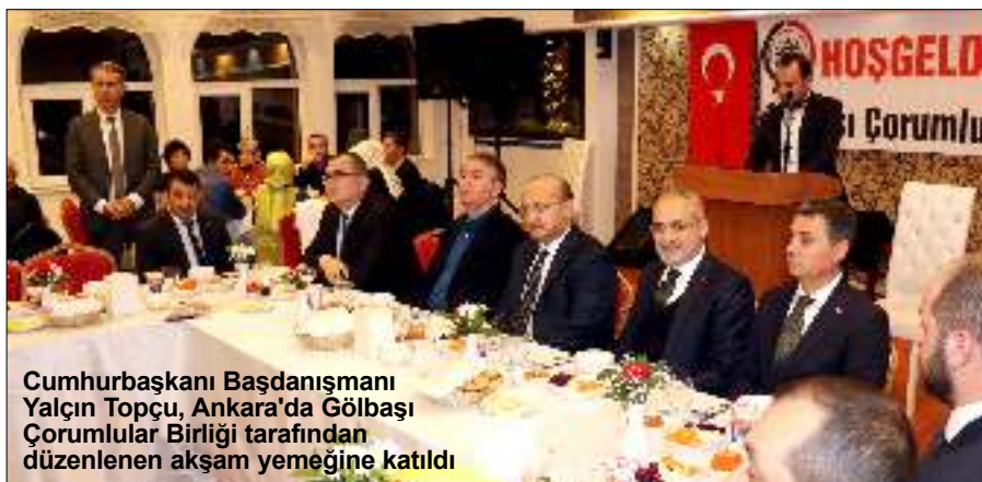
Cumhurbaşkanı Başdanışmanı Yalçın Topçu, Ankara'da Gölbaşı Çorumlular Birliği tarafından düzenlenen akşam yemeğine katıldı

Cumhurbaşkanı Başdanışmanı Yalçın Topçu, "Biz de seçimler olunca birbirine benzemezler bir araya getiriliyor, terör örgütleri yanlarına veriliyor, yetmiyor bir bakıyor-sunuz ki anlı şanlı Avrupa başkentlerinin anlı şanlı gazeteleri olan BBC, CNN, Reuters, Der Spiegel Cumhurbaşkanımızla ilgili negatif bir propaganda başlatıyorlar" dedi. Cumhurbaşkanı Başdanışmanı Yalçın Topçu, Ankara'nın Gölbaşı ilçesinde Gölbaşı Çorumlular Birliği Derneğinin organize ettiği akşam yemeğine katıldı. 3'DE