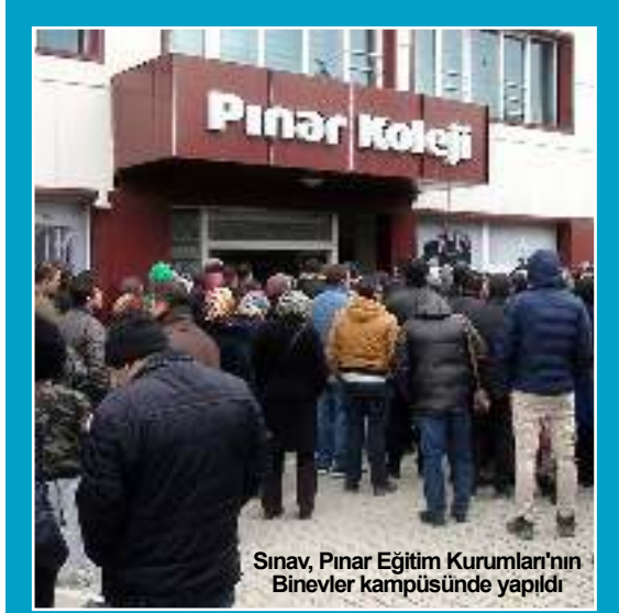
Sınav, Pınar Eğitim Kurumları'nın Binevler kampüsünde yapıldı