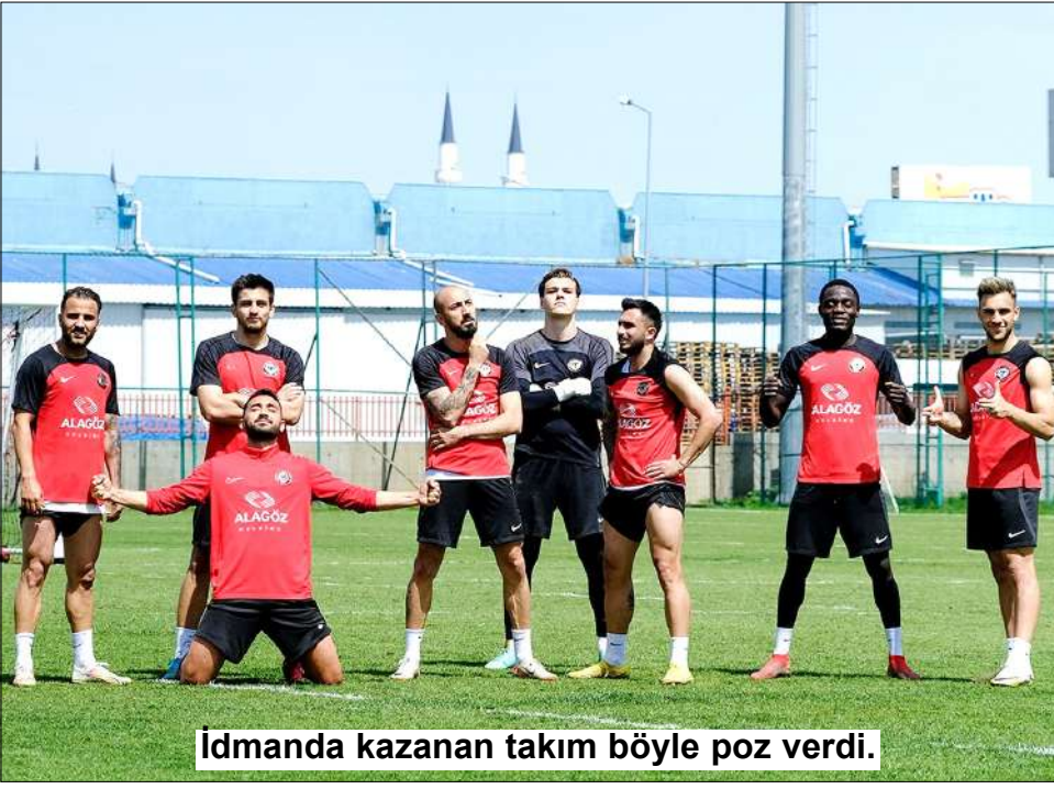
Idmanda kazanan takım böyle poz verdi.

Temsilcimiz Ahlatcı Çorum FK pazar günü karşılaştığı Adanaspor maçı hazırlıklarını hızlandırdı.