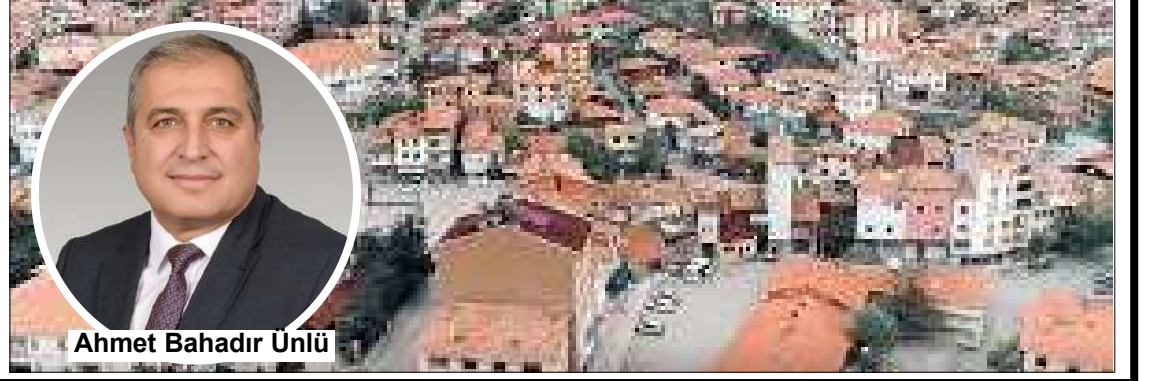
Ahmet Bahadır Ünlü