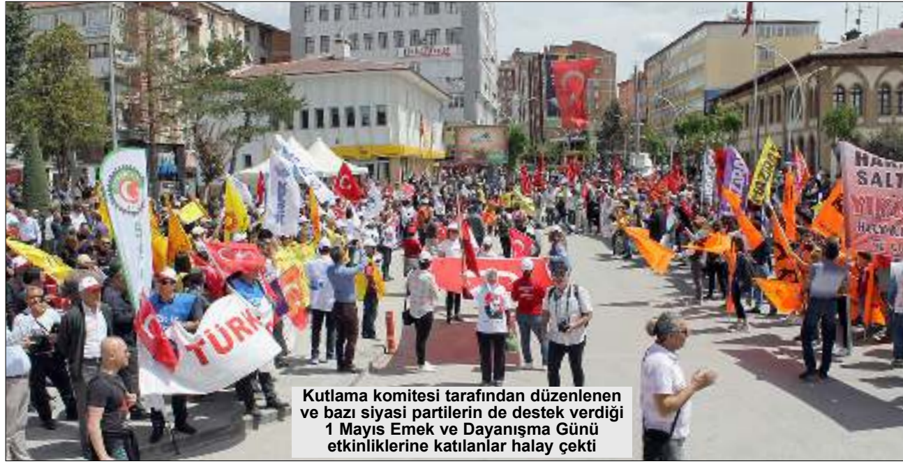
Kutlama komitesi tarafından düzenlenen ve bazı siyasi partilerin de destek verdiği 1 Mayıs Emek ve Dayanışma Günü etkinliklerine katılanlar halay çektii

Çorum'daki 1 Mayıs Emek ve Dayanışma Günü etkinliklerine hem İstiklal Marşı krizi hem de HDP'nin katılımı güne damga vurdu. 1 Mayıs Emek ve Dayanışma Günü Çorum'da etkinliklerle kutlandı. Türk-İş, KESK ve DİSK'in içinde yer aldığı kutlama komitesi tarafından düzenlenen 1 Mayıs Emek ve Dayanışma Günü etkinliklerine bazı siyasi partiler de destek verdi. Hürriyet Meydanı'nda yapılan 1 Mayıs kutlama etkinlikleri sırasında yine İstiklal Marşı krizi yaşandı. Daha önceki 1 Mayıs kutlama etkinliklerinde de İstiklal Marşı okunup okunmaması konusunda tartışmalar yaşanmıştı. Etkinliği katılanlar arasında İstiklal Marşı konusunda yine gerginlik yaşandı. 1 Mayıs kutlama etkinlikleri saygı duruşunda bulunulmasıyla başladı. Saygı duruşunun ardından İstiklal Marşı okunmadan program başlatıldı. 5'DE