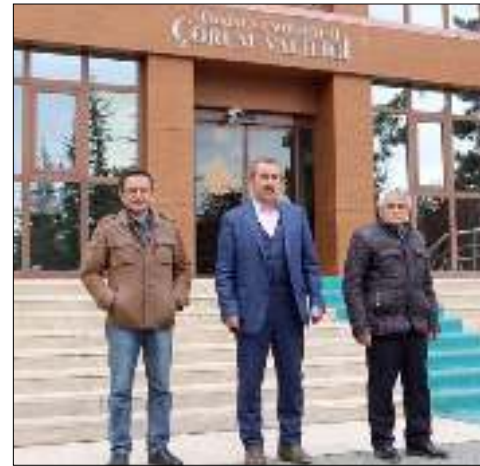
bettığımız için başkasının kazandığı muhtarlığı yapmak istemiyoruz." diyen Akpınar, "Kendimiz kazanalım, kendimiz yapalım dü-

şüncesindeyiz. Devletin verdiği maaş da 5 yıl boyunca boğazımızdan geçmesin. Kazandığımız muhtarlığı ve hak ettiğimizi alalım." ifadesini kullandı.