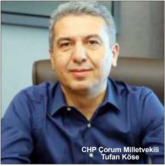
CHP Çorum Milletvekili Tufan Köse