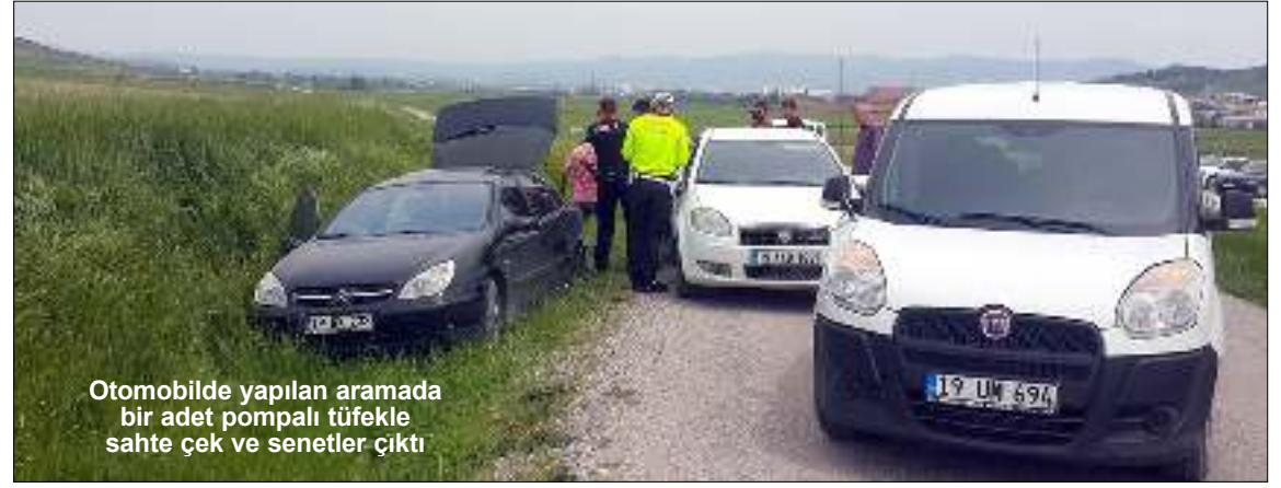
Otomobilde yapılan aramada bir adet pompalı tüfekte sahte çek ve senetler çıktı

Zanlıların yakalanmasının ardından araç sahibi olay yerine gelerek otomobilini inceledi.