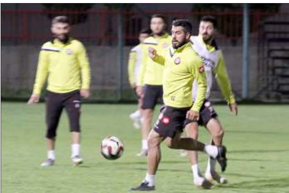
Yeni Çorumsporlu futbolcular, ısınma ile başlayan antrenmanda 5'e 2, kanat versiyonları ve yarı alanda toplu çalışma yaptı