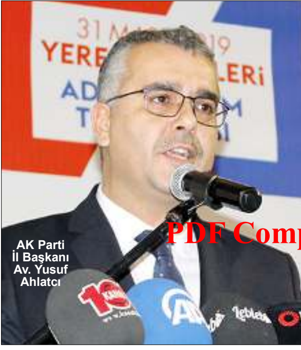
AK Parti İl Başkanı Av. Yusuf Ahlatcı