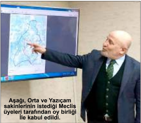
Aşağı, Orta ve Yazıçam sakinlerinin istediği Meclis üyeleri tarafından oy birliği ile kabul edildi.

Yapılan oylamada Aşağı, Orta ve Yazıçam sakinlerinin istediği Meclis üyeleri tarafından oy birliği ile kabul edildi. (Haber Merkezi)