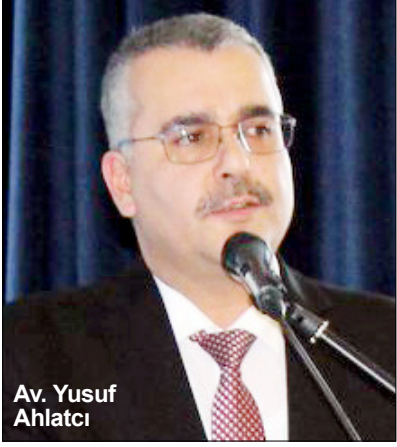
Av. Yusuf Ahlatcı