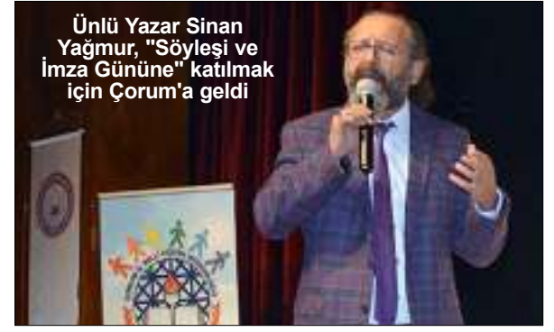
Ünlü Yazar Sinan Yağmur, "Söyleşi ve İmza Gününe" katılmak için Çorum'a geldi

özden Abonelik ve Siparişleriniz için www.ozdengazetesi.com.tr GAZETESİ VE YAYINLARI 0 212 518 23 97