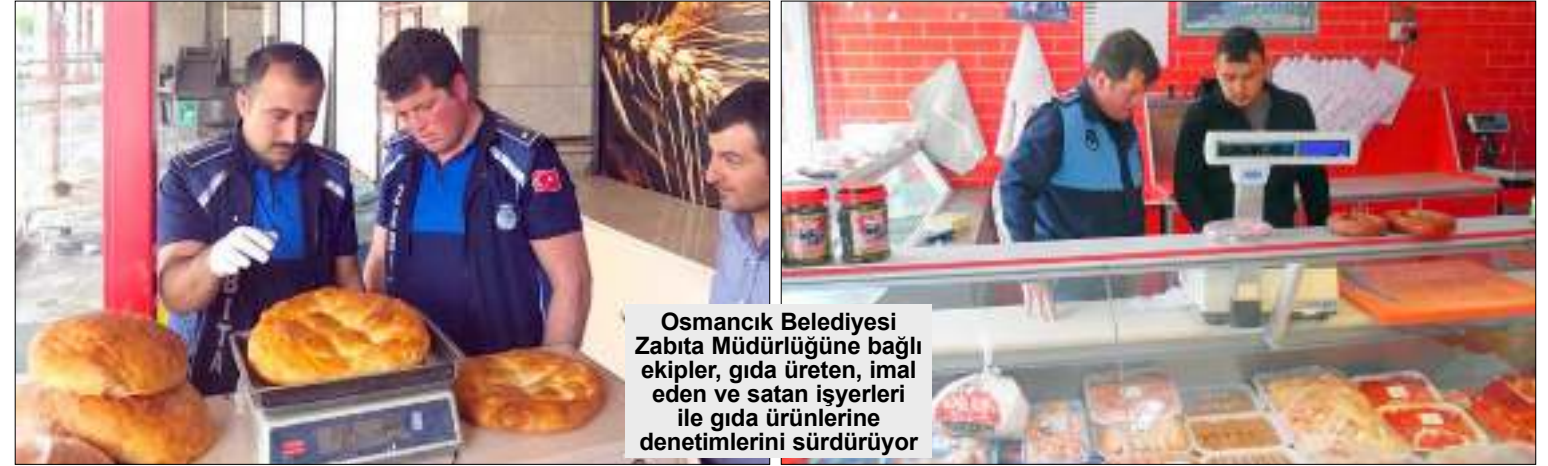
Osmancık Belediyesi Zabıta Müdürlüğüne bağlı ekipler, gıda üreten, imal eden ve satan işyerleri ile gıda ürünlerine denetimlerini sürdürüyor

Yapılan denetimlerde standartlara uymayan işyerlerine tutanak tutularak gerekli ikazlarda bulunuldu. (Haber Merkezi)