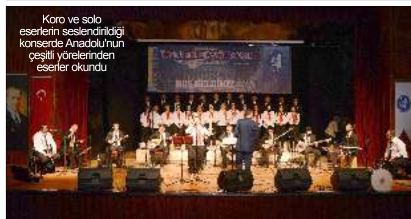
Koro ve solo eserlerin seslendirildiği konserde Anadolu'nun çeşitli yörelerinden eserler okundu

Oruç, namaz gibi kutsiyetimizi geliştirecek icapları bilerek, faydalanarak yapalım. Bir namazdan kazandığımız manevi kuvveti kaybetmeden, öteki namazlardan kazandığımız manevi kuvvet üstüne gelsin de böyle manevi kuvvet kazançlarımız bize yetenekli insan olmamızı sağlasın. Bu yılın mazbut orucundan akli melekelerimiz kuvvet bulsun ve bulduğumuz kuvveti zayetmeden gelecek sene daha üstüne kuvvet gelsin. Böyle manevi kuvvetlerin toplamıyla sonsuz bir yeteneğe sahip olalım. Yeteneğimizi kullanıp mesut, münevver, başarılı, yeterli insan olarak Yüce Allah'ın şerefli insanlığını temsile muktedir olalım diye anlatmaya çalışıyoruz.