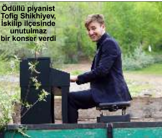
Ödüllü piyanist Tofiq Shikhiyev, İskilip ilçesinde unutulmaz bir konser verdi

Sungurlu ilçesinde meydana gelen trafik kazasında 1 kişi yaralandı. Edinilen bilgilere göre kaza Sungurlu-Çorum karayolu Arifgazili Köyü yakınlarında meydana geldi. 3'DE