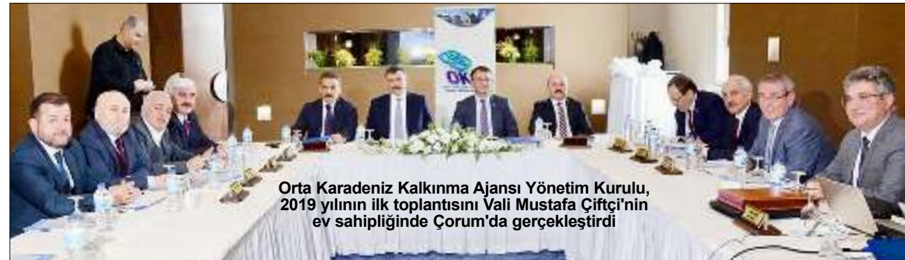
Orta Karadeniz Kalkınma Ajansı Yönetim Kurulu, 2019 yılının ilk toplantısını Vali Mustafa Çiftçi'nin ev sahipliğinde Çorum'da gerçekleştirdi

Orta Karadeniz Kalkınma Ajansı, "Turizmin Geliştirilmesine Yönelik Küçük Ölçekli Altyapı Yatırımlarına Mali Destek Programı" ve "Organize Sanayi Bölgelerinde (OSB) Ortak Üretim Altyapısının İyileştirilmesi Mali Destek Programı" kapsamında Çorum'dan 8 projeye hibe desteği sağlayacak. Orta Karadeniz Kalkınma Ajansı Yönetim Kurulu, 2019 yılının ilk toplantısını Çorum'da gerçekleştirdi. Toplantı, Çorum Valisi Mustafa Çiftçi'nin ev sahipliğinde kentteki bir otelde gerçekleştirildi. 5'DE