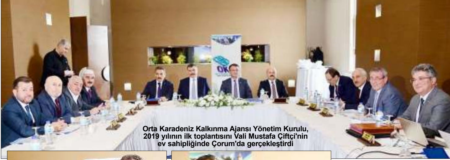
Orta Karadeniz Kalkınma Ajansı Yönetim Kurulu, 2019 yılının ilk toplantısını Vali Mustafa Çiftçi'nin ev sahipliğinde Çorum'da gerçekleştirdi

Orta Karadeniz Kalkınma Ajansı, "Turizmin Geliştirilmesine Yönelik Küçük Ölçekli Altyapı Yatırımlarına Mali Destek Programı" ve "Organize Sanayi Bölgelerinde (OSB) Ortak Üretim Altyapısının İyileştirilmesi Mali Destek Programı" kapsamında Çorum'dan 8 projeye hibe desteği sağlayacak.