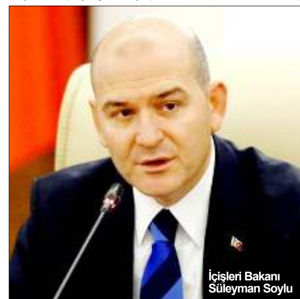
İçişleri Bakanı Süleyman Soylu

İçişleri Bakanı Süleyman Soylu, vatandaşları bu tür dolandırıcılara karşı uyarırken, dolandırıcıların ekmeğine yağ süren Twitter'ın reklam moderasyonuna da tepki gösterdi. Soylu, Twitter'deki hesabından, "Vatandaşlarımızı, Twitter'ın, kullanıcı güvenliğini sağlamaktan çok uzak, 'hayal kırıklığına uğratan' reklam moderasyonuna ve bu sahte hesaplarla dolandırıcılık yapan profillere karşı dikkatli olmalarını rica ediyorum" paylaşımını yaptı. (Haber Merkezi)