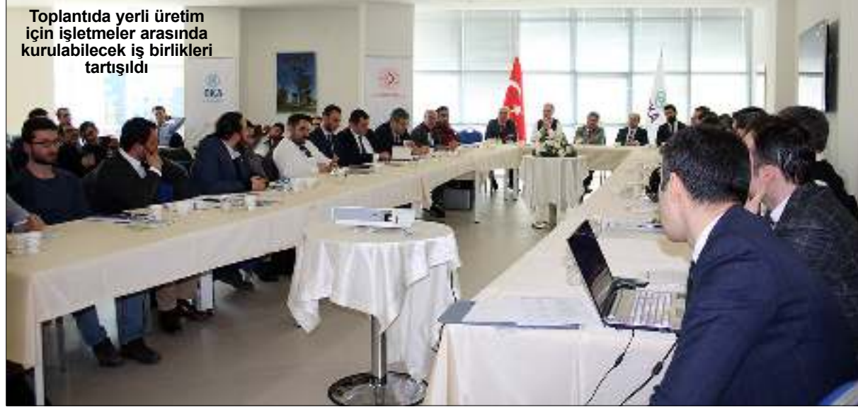
Toplantıda yerli üretim için işletmeler arasında kurulabilecek iş birlikleri tartışıldı

En az 24 dönem (vergileendirme dönemi 3 aylık olanlar için en az 8 dönem) KDV beyanamesi vermiş olması. Daha önce en az üç vergileendirme dönemine ilişkin iade talebinin sonuçlanmış olması. Kendisi, ortakları, ortakları ve kanuni temsilcilerinin özel esaslara tabi olmaması. Hazine ve Maliye Bakanlığının ilgili birimlerince yapılan değerlendirme ve analizler sonucunda bireysel olarak veya organize bir şekilde sahte belge düzenleme tespiti nedeniyle incelemeye sevk edilmemiş olması. Hazine ve Maliye Bakanlığının ilgili birimlerince iade taleplerinin riskli iade kapsamında incelemeye sevk edilmemiş olması." (Haber Merkezi)