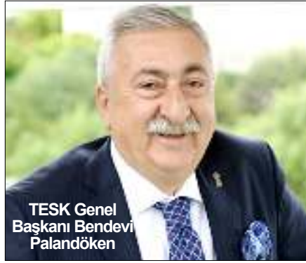
TESK Genel Başkanı Bendevi Palandöken

"Zincir marketler ve AVM'lerdeki mağazalar türlü fiyat oyunları yaparak, normalin çok üzerinde fiyat artışlarıyla vatandaşlara zarar veriyor. Geçen yıl yaşanan ekonomik dalgalanmayı bahane göstererek, zincir marketlerde özellikle gıda ürünlerinde, AVM'lerde de türlü konfeksiyon, ayakkabı, beyaz eşya ve yiyecek içecek ürünlerinde maliyetin kat ve kat üzerinde yüksek fiyatlar yansıtılıyor. Zaten kural dışı açılışları esnafın ekmeğini böldüğü gibi, bu fiyat istikrarsızlığı da vatandaşları ve enflasyonu olumsuz etkiliyor. Bu fiyat istikrarsızlığı ve kural dışılıklara artık son verilmeli. Çünkü kural dışı çoğalan her zincir market küçük esnafın iş yerini kapatmasına sebep olur. Bu da yeni işsizlik ve beraberinde sosyal patlamayı