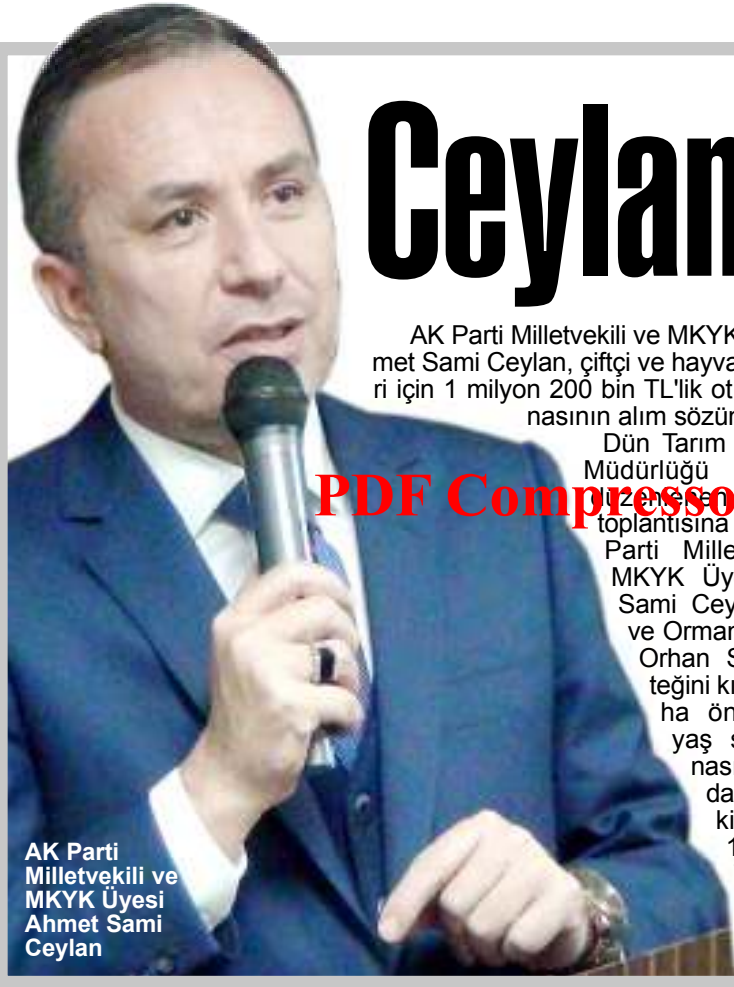
AK Parti Milletvekili ve MKYK Üyesi Ahmet Sami Ceylan