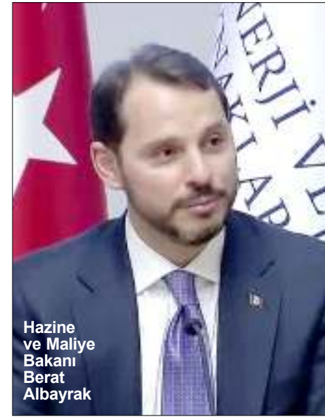
Hazine ve Maliye Bakanı Berat Albayrak

Ekonomik aktivitenin desteklenmesi adına daha fazla harcama ile bütçe hedeflerinden vazgeçilme ihtimaline yönelik bir soruya ise Albayrak, şöyle yanıt verdi: "Hedeflerimizi gerçekleştirmekte kararlıyız ve şimdiye dek tam olarak bunu yaptık. Evet, ekonomik aktiviteyi desteklemek, ekonominin kırılan kesimlerini korumak, işleri korumak ve yüksek katma değerli üretimi desteklemek için finansal koşulları kolaylaştırmak için bazı önlemler alıyoruz. Ancak bunlar, daha geniş politikamızdan sapma anlamına gelmiyor." Ekonomiyi desteklemek adına atılan adımları "hedeflere ulaşmak için ince ayarlar" olarak tanımlayan Albayrak, "İstihdam tabanını ve üretim tabanını korumak için bazı sektörlere seçici, zamanlıca ve ölçülü mali teşvikler uyguluyoruz. Mali disiplinden tavize gelince, sözüme güvenin; gerçekleşmeyecek... Mali disiplin, ekonomi politikamızın ana dayanağı olmaya devam ediyor" dedi.