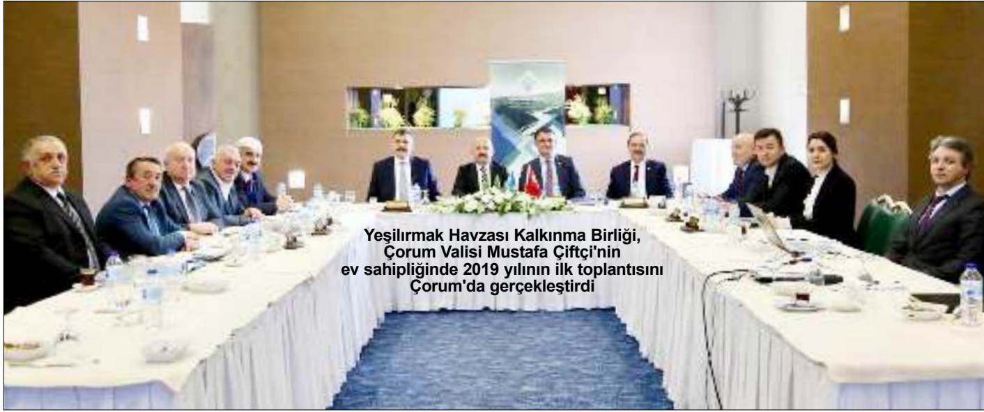
Yeşilirmak Havzası Kalkınma Birliği, Çorum Valisi Mustafa Çiftçi'nin ev sahipliğinde 2019 yılının ilk toplantısını Çorum'da gerçekleştirdi

Meclis toplantısından sonra YHKB Encümen toplantısı gerçekleştirildi. Toplantıda aylık cetveller tetkik edildi. Toplantı görüş alışverişisi ve değerlendirilmelerle devam etti. (Haber Merkezi)