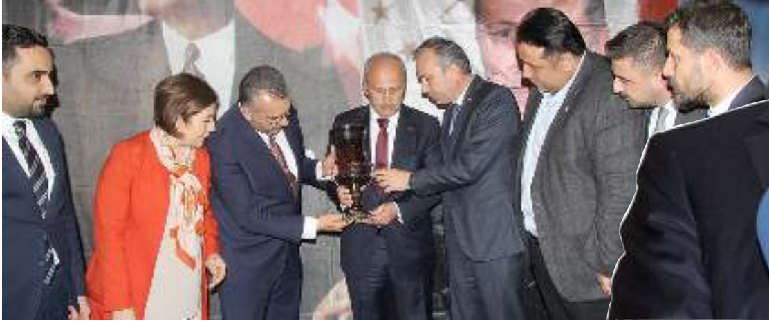
Ulaştırma ve Altyapı Bakanı Mehmet Cahit Turhan

Ulaştırma ve Altyapı Bakanı Mehmet Cahit Turhan, Çorum'un havaalanı talebiyle ilgili, "İl başkanımız bana 'Çorum için bir havaalanı talebini' söyledi. Eğer Çorum'a bir havaalanı yapılacaksa bunu kim yapar? AK Parti yapar, onlar konuşur AK Parti yapar. Havaalanı için fizibilite ve etüt çalışmalarını başlatıyoruz" diye konuştu.