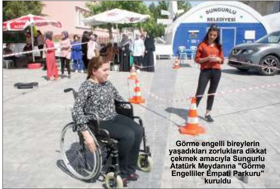
Görme engelli bireylerin yaşadıkları zorluklara dikkat çekmek amacıyla Sungurlu Atatürk Meydanına "Görme Engelliler Empati Parkuru" kuruldu