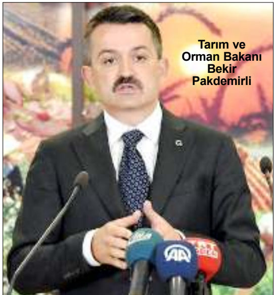
Tarım ve Orman Bakanı Bekir Pakdemirli