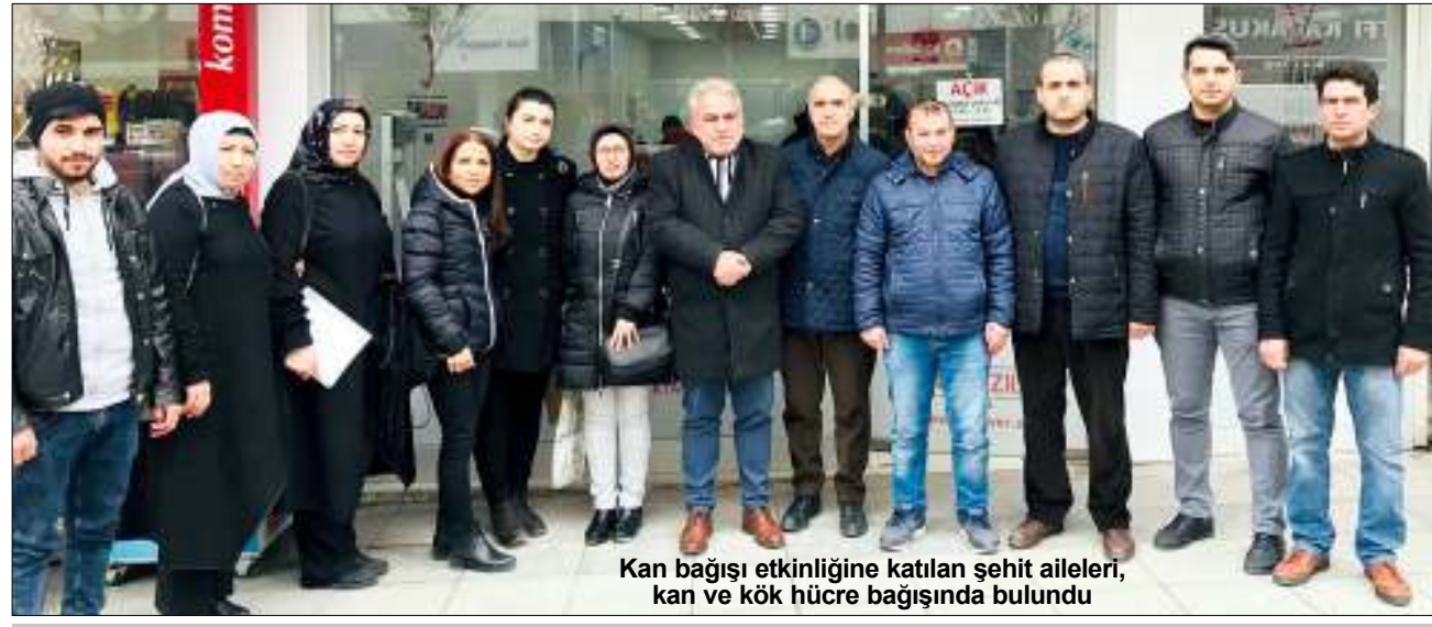
Kan bağışı etkinliğine katılan şehit aileleri, kan ve kök hücre bağışında bulundu

Çorum Şehit Aileleri ve Vazife Malulleri Derneği, Türk Kızılayının kan bağışı kampanyasına destek verdi. Türk Kızılayı tarafından Gazi Caddesi üzerindeki Hitit Kan Alma Biriminde gerçekleştirilen kan bağışı etkinliğine katılan şehit aileleri, kan ve kök hücre bağışında bulundu. Etkinlikte ilk etapta Kızılay görevlileri tarafından kök hücre ve kan bağışı hakkında şehit ailelerine bilgilendirme yapıldı. Kök hücre ve kan bağışının birçok insana umut olduğu ifade edilirken, kan bağışının sağlık açısından faydalarına dikkat çekildi. Bağış formlarını dolduran şehit aileleri, sağlık kontrolünden geçirildikten sonra Kızılay tarafından kurulan stantlarda kök hücre ve kan bağışı yaptı. 6'DA