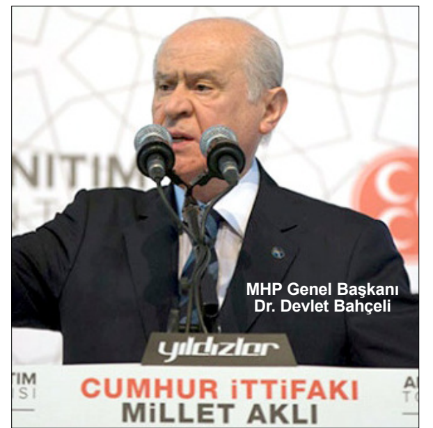
MHP Genel Başkanı Dr. Devlet Bahçeli

Seçimlerde Cumhuriyet Halk Partisi'ne sahip çıkılmasını isteyen Bahçeli, "Cumhuriyet Halk Partisi'nin seçimlerini şuurla benimsemiş, Türkiye Cumhuriyeti'ni yükseltme amacına sebatla odaklanmış, Türkiye Cumhuriyeti sistemsel yenilenmeyi başarmış, bunu da başkalaşmadan değişerek elde etmiştir. Cumhurbaşkanlığı Hükümet Sistemi'nin iyice yerleşip kökleşmesi hayat memat konusudur. 1 Nisan sabahı için felaket senaryoları yazarların hevesleri kursaklarında kalacaktır. Bu yeni sistemin mimarlarından birisi de Milliyetçi Hareket Partisi'dir" ifadelerini kullandı.