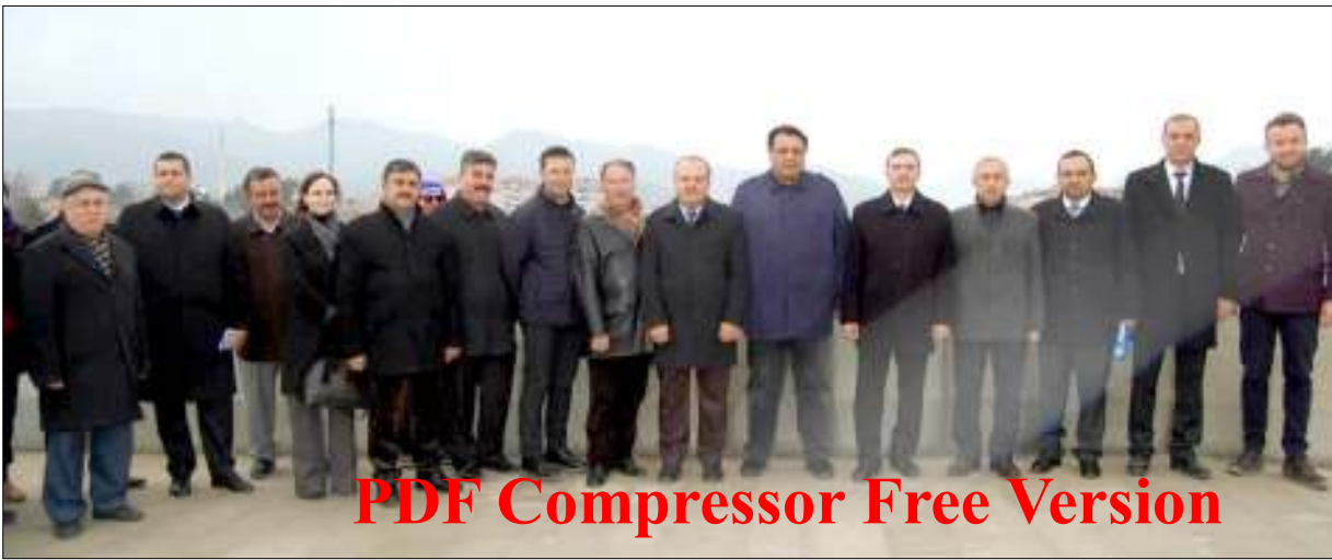
PDF Compressor Free Version