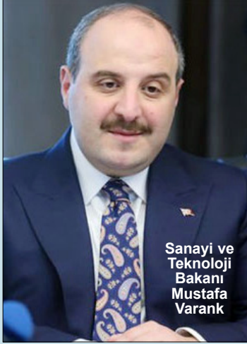
Sanayi ve Teknoloji Bakanı Mustafa Varank

İstanbul Ticaret Odası (İTO) Bilgiyi Ticarileştirme Merkezi açılış törenine katılan Sanayi ve Teknoloji Bakanı Mustafa Varank, "Geçtiğimiz sene gençlerimiz bu program sayesinde 26 milyon liralık destekten faydalandı. Programın 2020 çağrısı hala açık. Gençlerimiz 200 bin liraya kadar hibe desteğinden faydalanabilirler. Ekonomik görünümümüz canlanmaya devam ediyor. Geçen senenin 3'üncü çeyreğinden itibaren yeniden büyüme eğilimine girdik. Faizler düşüyor, iç talep canlanıyor" dedi. Törende konuşan Bakan Varank, şu şekilde açıklamada bulundu: