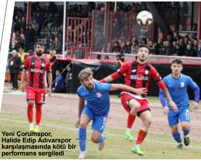
Yeni Çorumspor, Halide Edip Adıvarspor karşılaşmasında kötü bir performans sergiledi