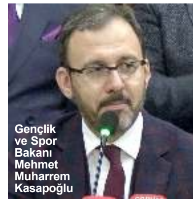
Gençlik ve Spor Bakanı Mehmet Muharrem Kasapoğlu

Daha sonra söz alan Çorum Milletvekilleri Oğuzhan Kaya ise Çorum'a yapılan yatırımlar nedeniyle Bakan Kasapoğlu'na teşekkür ederek, "Biz parti olarak gençlerimize siyasal ve sportif anlamda her düzenlemeyi yapan bir parti-