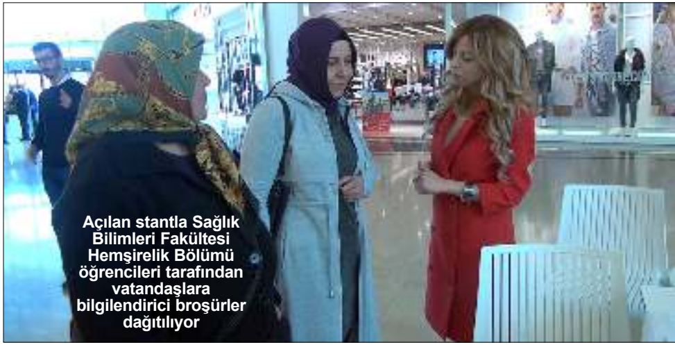
Açılan stantla Sağlık Bilimleri Fakültesi Hemşirelik Bölümü öğrencileri tarafından vatandaşlara bilgilendirici broşürler dağıtılıyor