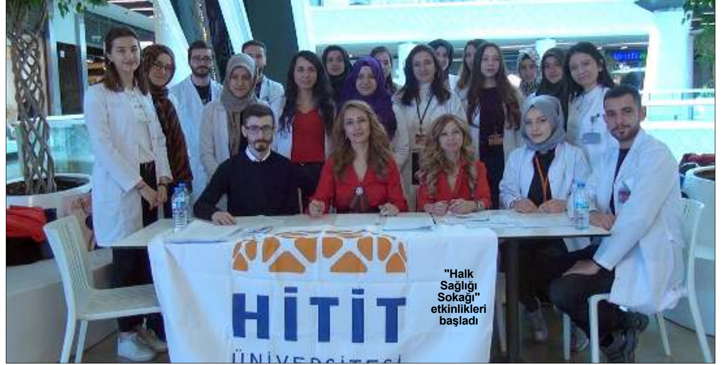
"Halk Sağlığı Sokağı" etkinlikleri başladı

"Fakültemiz Halk Sağlığı Anabilim Dalı olarak ilimizde bu yıl 'Halk Sağlığı Sokağı' etkinliklerinin ilkinin başlatmış bulunuyoruz. Halk Sağlığı, örgütlenmiş toplumsal çalışmalar aracılığıyla; hastalıkları önleme, yaşamı uzatma, ruhsal ve fiziksel