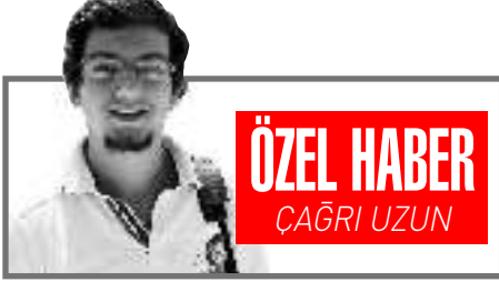
ÖZEL HABER ÇAĞRI UZUN

Çorum'da Hitit Üniversitesi Sağlık Bilimleri Fakültesi ve İl Sağlık Müdürlüğü tarafından başlatılan "Halk Sağlığı Sokağı" projesi kapsamında Hemşirelik bölümü öğrencileri sağlıkla ilgili önemli gün ve haftalarda alışveriş merkezinde açtıkları stantla toplumu bilinçlendiriyor.