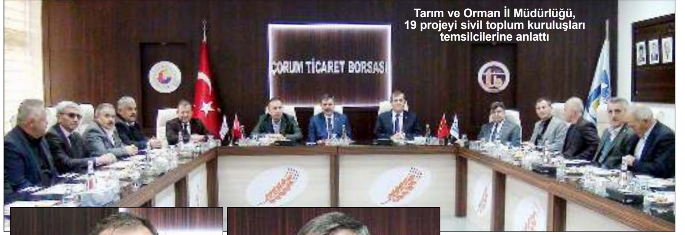
Tarım ve Orman İl Müdürlüğü, 19 projeyi sivil toplum kuruluşları temsilcilerine anlattı

Çorum'da tarımsal üretim ve tarım sanayinin gelişmesine yönelik bir dizi proje hazırlandığını kaydeden Vali Çiftçi, İl Tarım Müdürlüğü'nün önümüzdeki 3 yıl için uygulamayı hedeflediği 19 proje belirlediğini açıkladı. Çiftçi "Sertifikalı tohum üretimi, hayvan satış borsası, kültür kafes balıkçılığı, havansal gübre kullanımı, yöresel ürün satış yerleri, organik bal üretimi, merinos ırkı hayvancılığın yaygınlaşması, meraların ıslahı ve lisanslı depoculuk gibi projeler yer alıyor. 3 yıl içinde bu hedefleri yer-