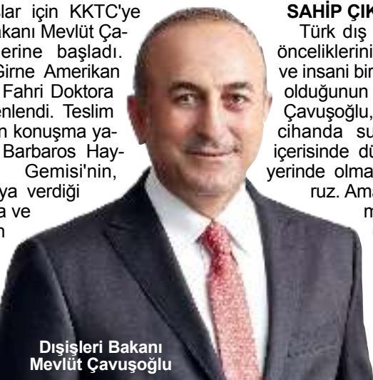
Dışişleri Bakanı Mevlüt Çavuşoğlu

Türk dış politikasının önceliklerinin "girişimci ve insani bir dış politika" olduğunu altını çizen Çavuşoğlu, "Yurtta sulh cihanda sulh anlayışı içerisinde dünyanın her yerinde olmaya çalışıyoruz. Ama milli davamıza sahip çıkmak da bizim en önemli görevlerimizdir" diye konuştu. (Haber Merkezi)