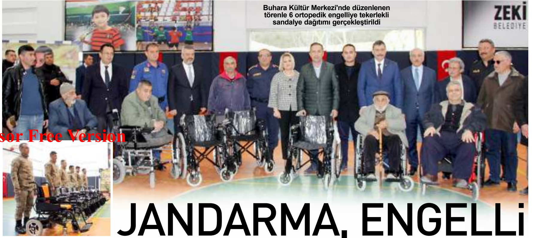
Buhara Kültür Merkezi'nde düzenlenen törenle 6 ortopedik engelliye tekerlekli sandalye dağıtımı gerçekleştirildi

Hamile kadınlar, hamilelik sırasında havuç yağı kullanmamalıdır. Hamilelik sırasında kullanılırsa kanamaya neden olabilir. Sara yani epilepsi rahatsızlığı bulunan kişiler havuç yağı kullanmamalıdır.