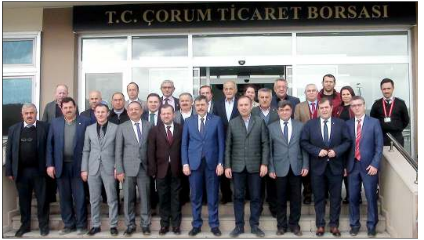
T.C. ÇORUM TİCARET BORSASI

"Belirlenen hedefe ulaşmak için STK başkanlarının desteği gerekiyor. Çorum'da tarım ve hayvancılıkla uğraşan STK'larda bir ahenk ve uyum var. Bu bizi son derece memnun ediyor. Sertifikalı tohumculuk önem verdiğimiz konular arasında. Sertifikalı tohumla ya-