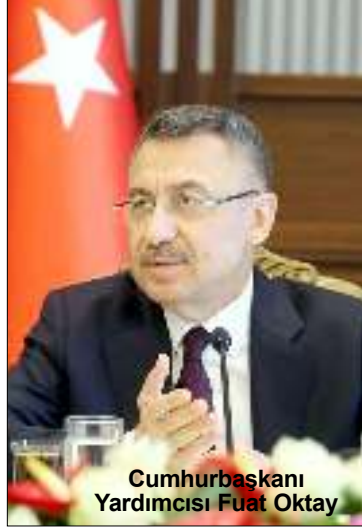
Cumhurbaşkanı Yardımcısı Fuat Oktay

Yozgatlı iş insanlarıyla Cumhurbaşkanlığı Külliyesi'nde bir araya gelen Cumhurbaşkanı Yardımcısı Fuat Oktay, "Yerelden kalkınma hamlesinin örneği Yozgat olacak. Ortak paydamız Yozgat. Bütün hem-