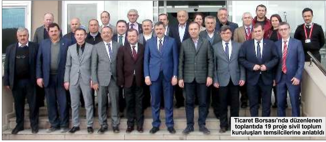
Ticaret Borsası'nda düzenlenen toplantıda 19 proje sivil toplum kuruluşları temsilcilerine anlatıldı

Çorum Valisi Mustafa Çiftçi ve AK Parti Çorum Milletvekili Ahmet Sami Ceylan, Çorum'daki tarımsal projeleri masaya yatırdı. Hatırlanacağı üzere geçtiğimiz Çarşamba günü Tarım ve Orman İl Müdürlüğü tarafından düzenlenen toplantıda kentteki hayvan üretiminin artırılması amacıyla bir toplantı düzenlenmiş, müdürlüğün projeleri büyükbaş hayvan üreticilerine sunulmuştu. Yine Tarım ve Orman İl Müdürlüğü tarafından hem tarım hem de hayvancılık sektörünün geliştirilmesi amacıyla sivil toplum kuruluşlarının temsilcilerinin katılımıyla bir toplantı gerçekleştirildi. 5'DE