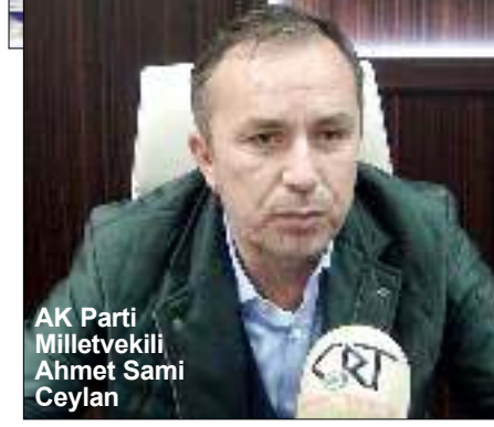
AK Parti Milletvekili Ahmet Sami Ceylan