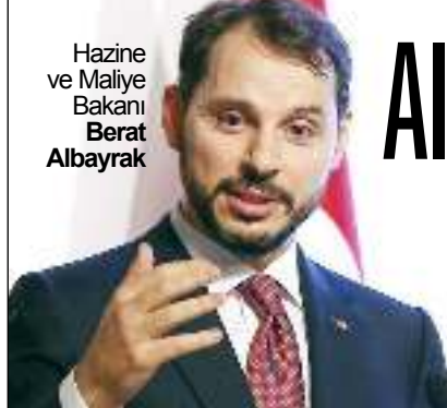
Hazine ve Maliye Bakanı Berat Albayrak

Yıldız güreşçi. 1-18.Haziran 2019 tarihlerinde Bursa'da Türkiye Olimpiyatlar Hazırlık Merkezinde yapılacak olan Yıldızlar Serbest Avrupa Güreş Şampiyonası kampına davet edildi. Şampiyonada 40 farklı kategoride 23 güreşçi yarışacak. (Haluk Söylemez)