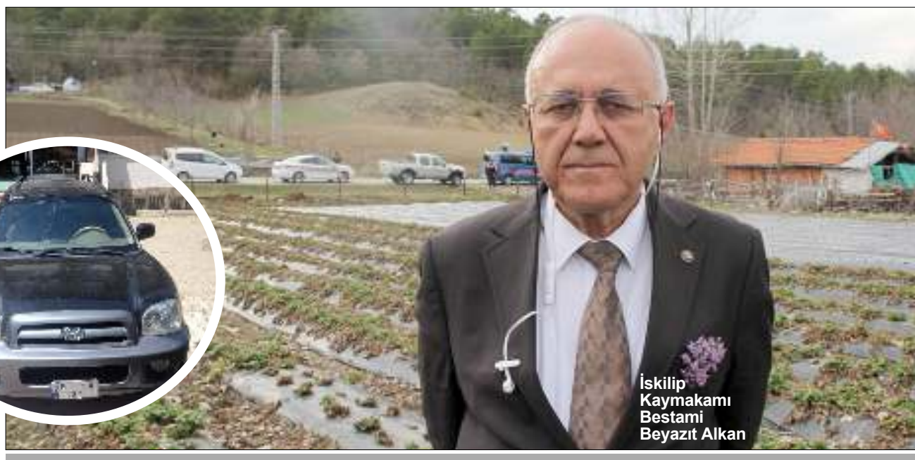
İskilip Kaymakamı Bestami Beyazıt Alkan

İskilip ilçesinde vatandaşlara dağıtılan çilek fidelerinin parasını ödemek için kaynak bulamadığını öne süren Kaymakam Bestami Beyazıt Alkan, makam aracını satılığa çıkardı. İlçede yaşanan kırsal göçün önüne geçebilmek için kolları sıvayan Kaymakam Alkan, İskilip'in köylerinde çilek üretimini teşvik etmek için bir proje başlattı. Kaymakamı Beyazıt Bestami Alkan'ın öncülüğünde 30 köyde çilek üretimi yapılması için harekete geçildi. Kırsalda yaşayan insanlara bugüne kadar 1 milyon 500 binin üzerinde çilek fidesi dağıtıldı. Kaymakamlık Özel bir firmadan temin edilen fidelerin bir kısmı için ödeme yaparken geriye 400 bin liralık bir borç kaldı. İskilip Kaymakamı Alkan, bu borcu ödemek için kaynak bulunmayınca makam aracını satılığa çıkardı. 2'DE