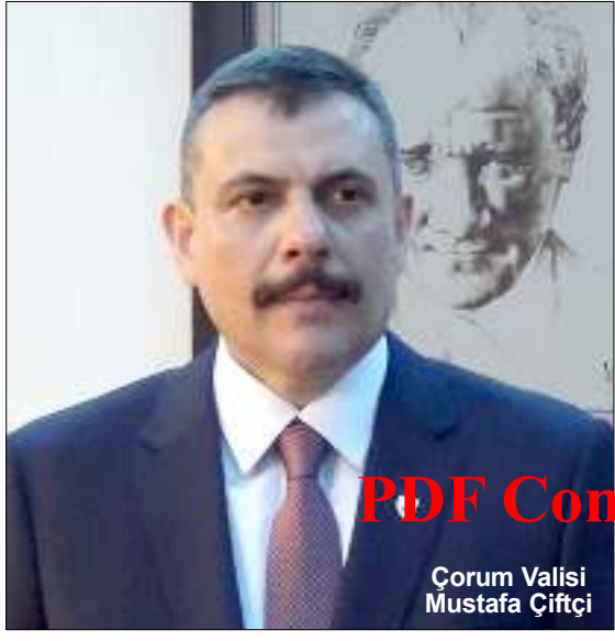
Çorum Valisi Mustafa Çiftçi