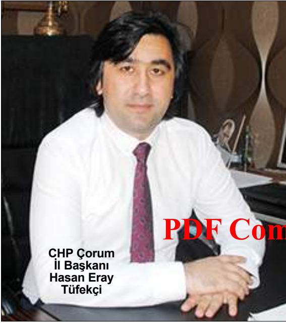
CHP Çorum İl Başkanı Hasan Eray Tüfekçi