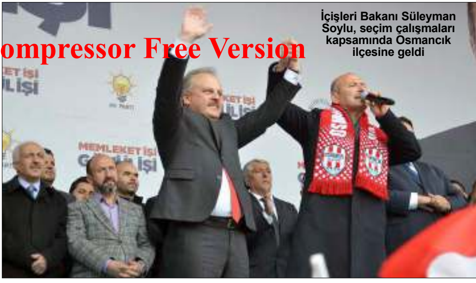
İçişleri Bakanı Süleyman Soylu, seçim çalışmalarında Ösmancık ilçesine geldi

İrak'ın kuzeyinde bir devlet kurmak istedikler. Eğer Recep Tayyip Erdoğan olmasaydı o devlet orada kurulmuştu. Erdoğan engelledi onu. ABD tahrik etti, Avrupa teşvik etti. O devleti orada kurup Türkiye'nin güneydoğusuna bir kama çakacaklardı. Bir taraftan Afrin'de de terör merkezi oluşturular. ABD binlerce tır silah gönderdi oraya. 20-25 kilometre hemen ötemizde Türkiye'yi tehdit edecek bir terör merkezi yapmak istediler. ABD bizi tehdit etti. Afrin'e girersen sonuçlarına katlanırsın dedi. Bizi eski Türkiye zannetti. Erdoğan ve Türkiye ABD'nin tehdidinde alırdı. Çatır çatır girdik Afrin'e. PKK'yı oradan sildik süpürdük. Dertleri buydu. Irak'ın kuzeyinde bir devlet, Afrin'de bir terör merkezi ardından arasına bir hat çekecekler ve Türkiye'yi güneyinden, orta doğudan ayıracaklardı. Bizi ticaret yollarımızdan ayıracaklardı. Kendi kültür coğrafyamızdan ayıracaklardı. Bunu beceremediler. Bunu Türkiye yaptırmadı onlara. Erdoğan ve Türkiye dünyaya bir mesaj verdi. Bu ülkenin bakanı olarak söylüyorum. Bu ülkenin huzurunu bozmaya çalışan, bölmeye çalışan hiç