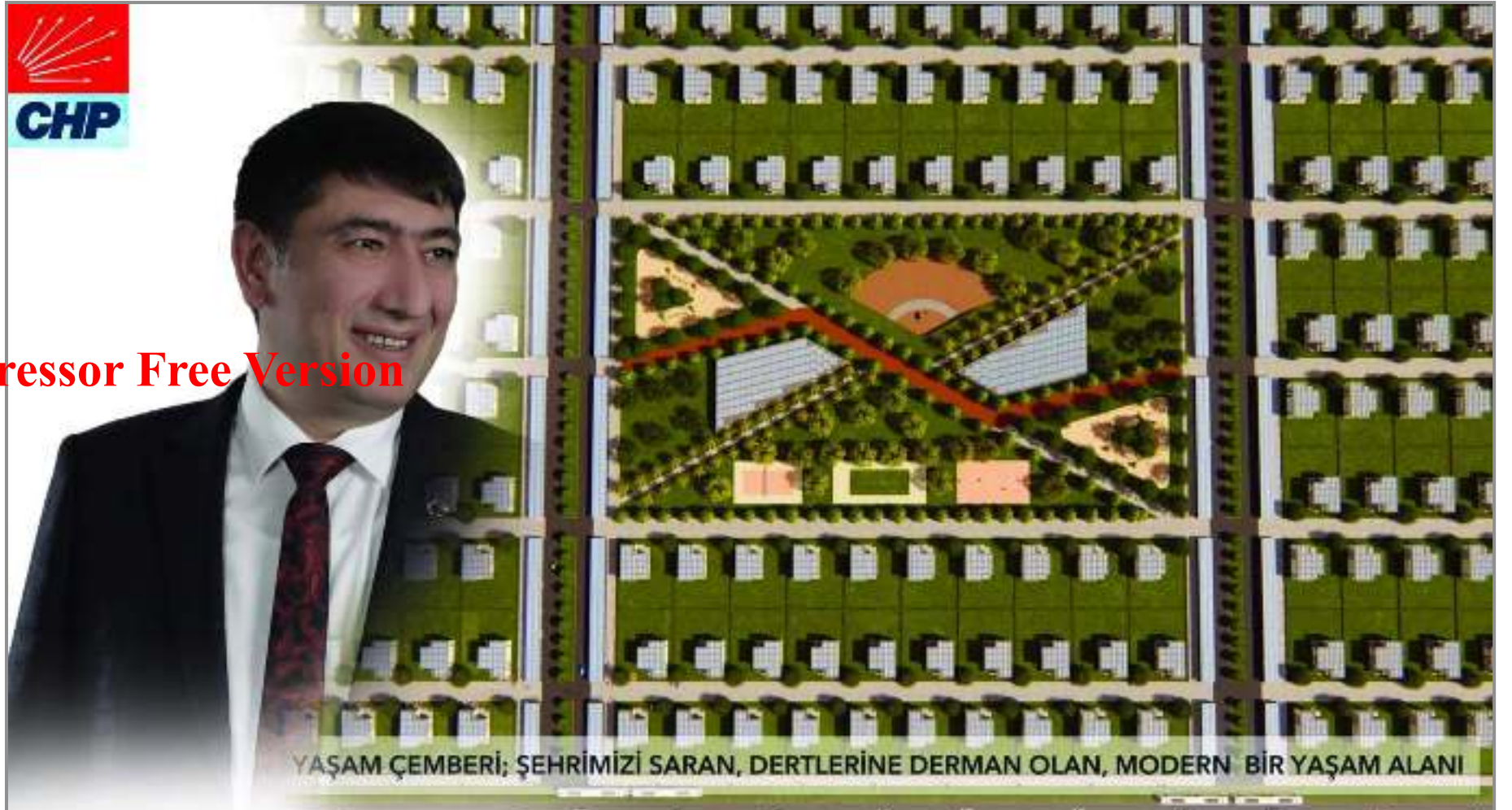
YAŞAM ÇEMBERİ; ŞEHİRİMİZİ SARAN, DERTLERİNE DERMAN OLAN, MODERN BİR YAŞAM ALANI

Biz gülersek herkes güler. Bu temennilerle 31 Mart yerel seçimlerinin ülkemize ve milletimize hayırlı olmasını temenni ediyorum. Kazanan Çorum olsun" şeklinde konuştu. (Haber Merkezi)