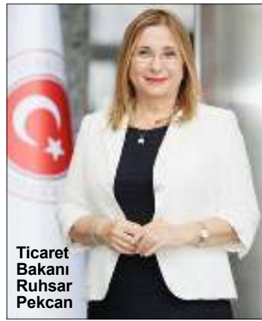
Ticaret Bakanı Ruhsar Pekcan

netimi Tebliği' uyarınca 'Dış Ticarette Risk Esaslı Kontrol Sistemi' (TAREKS) üzerinden ithalat aşamasında 'risk esaslı' olarak denetime tabi tutulduğunu söyledi. Pekcan "Denetimler 'Oyuncak Güvenliği Yönetmeliği' uyarınca yapılmakta olup, söz konusu yönetmeliğe uygun olmayan ürünlerin ithal edilmesine izin verilmemektedir. Bu kapsamda oyuncakların elektriksel, fiziksel, mekanik, kimyasal ve alevlenebilirlik özelliklerinin çocuklar için risk oluşturmayacak nitelikte olup ol-