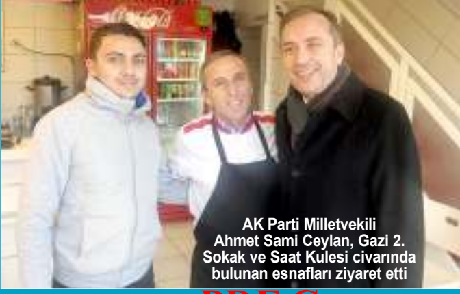
AK Parti Milletvekili Ahmet Sami Ceylan, Gazi 2. Sokak ve Saat Kulesi civarında bulunan esnafları ziyaret etti

AK Parti Çorum Milletvekili MKYK Üyesi Ahmet Sami Ceylan, esnaf ve vatandaşlarla bir araya geldi. TBMM çalışmalarından zaman zaman fırsat bulduca Çorum'a gelen Milletvekili Ceylan, Çorumlu seçmenin de derinlerini dinliyor. Milletvekili Ceylan partililer ile birlikte Gazi 2. Sokak ve Saat Kulesi civarında bulunan esnafları ziyaret etti. Esnafların sorun ve taleplerini dinleyen Ceylan, "Biz sizler için Ankara'dayız. Sizin sorunlarınız bizim sorunlarımızdır. Bu sorunlarınızın çözümü için biz buradayız. Bende esnafım ve içinizden biriyim. Sizleri ziyaret etmek benim için büyük bir zevktir" dedi. 4'DE