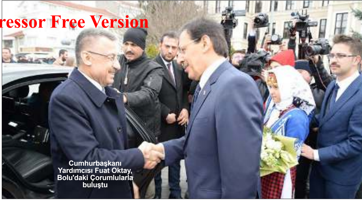
Cumhurbaşkanı Yardımcısı Fuat Oktay, Bolu'daki Çorumlularla buluştu