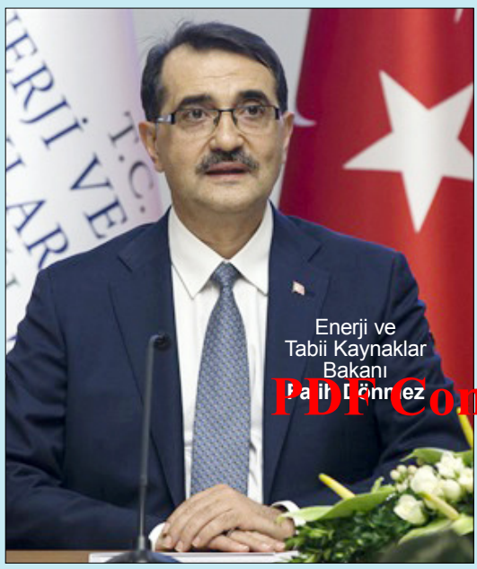
Enerji ve Tabii Kaynaklar Bakanı Fatih Dönmez