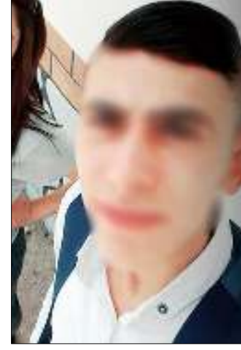
Yaralanan gençlere ilk müdahale olay yerinde yapıldı. Ardından tedavi edilmek üzere Hit

tit Üniversitesi Erol Olçok Eğitim ve Araştırma Hastanesi'ne sevk edildi. Olay yerine gelen polis ekipleri de şüphelileri bulmak için kentte geniş çaplı arama başlattı. Kent Güvenlik Sistemleriyle yerleri tespit edilen E.Ü. ve beraberindekiler, saatler sonra bulundu. Şüphelilerde yapılan aramada bir adet tüfek ele geçirildi. Yapılan aramanın ardından E.Ü. ve beraberindeki 6 kişi ateşli silahla yaralama ve öldürmeye teşebbüs suçlarından gözaltına alındı.