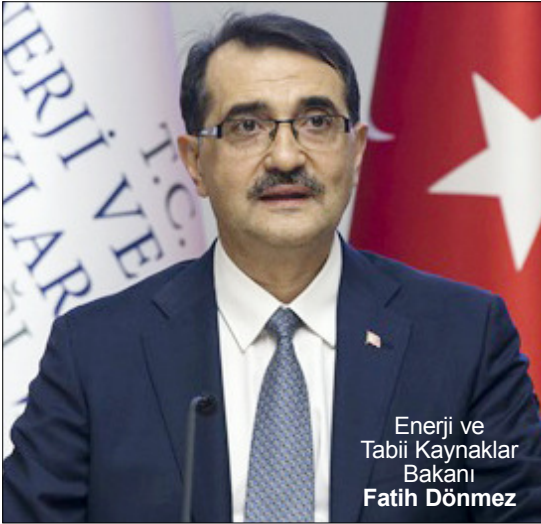
Enerji ve Tabii Kaynaklar Bakanı Fatih Dönmez