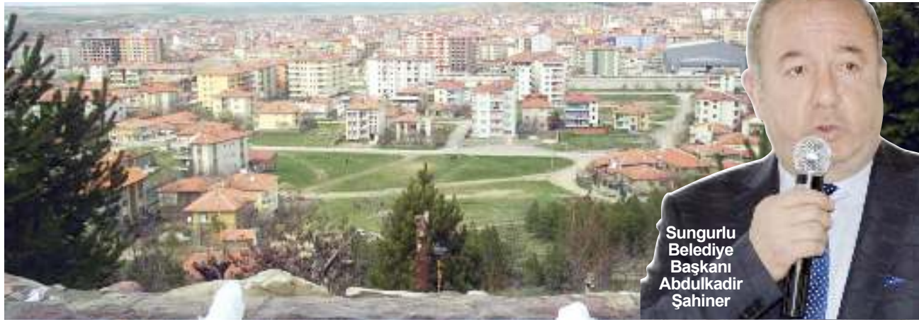
Sungurlu Belediye Başkanı Abdulkadir Şahiner

Sungurlu Belediyesi'nin elektrik borcundan dolayı Salman köyü su kuyuları ve terfi binasının elektriği kesildi. Ramazan ayına sayılı günler kala Sungurlu'da yaşayan 32 bin kişi susuzluk tehlikesiyle karşı karşıya kaldı. Sungurlu'nun su ihtiyacının karşılandığı Salman köyünde bulunan su kuyuları ve pompaların bulunduğu terfi binasının elektriği kesildi. Konuyla ilgili bir açıklama yapan Sungurlu Belediye Başkanı Abdulkadir Şahiner, AK Parti döneminden kalan 800 bin TL'lik borcun 500 bin TL'sini ödemelerine rağmen su deposunun elektriğinin kesildiğini ifade etti. 2'DE