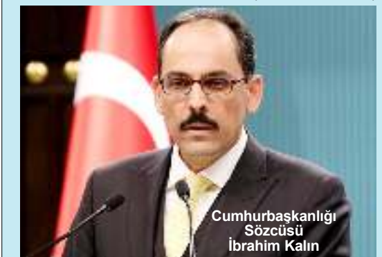
Cumhurbaşkanlığı Sözcüsü İbrahim Kalın

Bu tip rivayetlere itibar edilmesin, bunlar algı operasyonlarıdır. Türkiye için IMF yılları geride kaldı. Kim tarafından gelirse gelsin özellikle Doğu Akdeniz'de bir oldubittiyeye Türkiye'nin göz yummayacağını herkesin bilmesi gerekir." (Haber Merkezi)