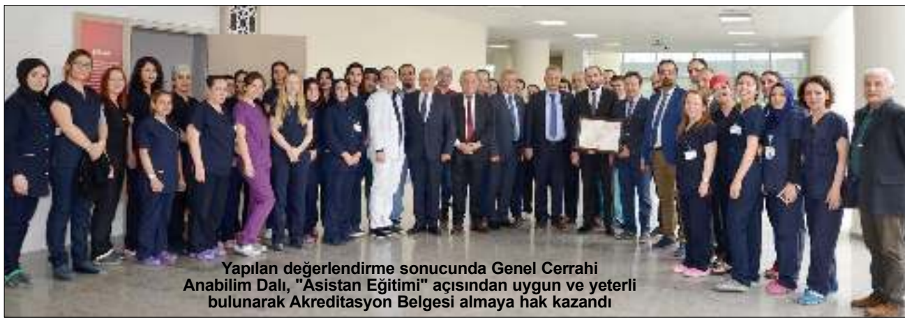
Yapılan değerlendirme sonucunda Genel Cerrahi Anabilim Dalı, "Asistan Eğitimi" açısından uygun ve yeterli bulunarak Akreditasyon Belgesi almaya hak kazandı