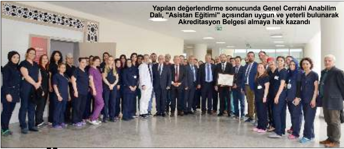
Yapılan değerlendirme sonucunda Genel Cerrahi Anabilim Dalı, "Asistan Eğitimi" açısından uygun ve yeterli bulunarak Akreditasyon Belgesi almaya hak kazandı

İl Müftülüğü'nden yapılan açıklamada da tüm hazırlıkların tamamlandığı bildirildi. Camilerde Ramazan boyunca Hatmi Kurul üyelerinden oluşan heyet iftar ziyafeti sunulacak. Yine camilerde 10:00-11:00 ile 14:00-15:00 saatlerinde vaizler tarafından bayanlara özel vaazlar verilecek. Ramazan ayı bu sene 29 gün sürecek. (Haluk Söylemez)