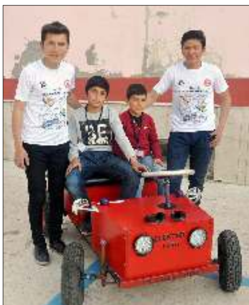
Sungurlu'da köy okulu öğrencileri geçtiğimiz yıl hız motorundan yaptıkları arabayı bu yıl geliştirerek elektrikli araba yaptı