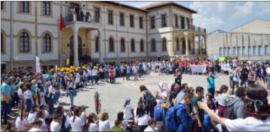
Çorum'a gelen gönüllüler, Çorum Müzesi bahçesinde tanışma etkinliğinde bir araya geldi