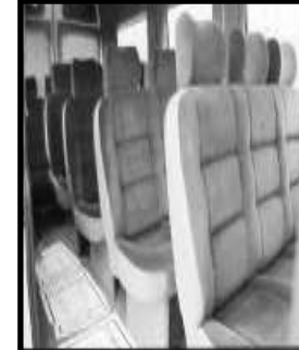
Servis araçları standart tasarımı