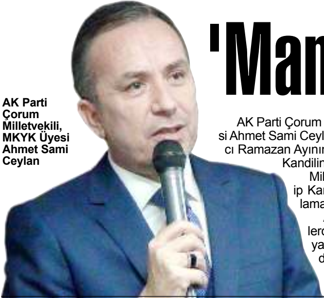
AK Parti Çorum Milletvekili, MKYK Üyesi Ahmet Sami Ceylan