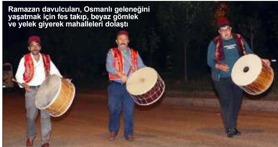
Ramazan davulcuları, Osmanlı geleneğini yaşatmak için fes takıp, beyaz gömlek ve yelek giyerek mahalleleri dolaştı

Çorum'da Osmanlı geleneğini yaşatmak için fes takıp, beyaz gömlek ve yelek giyerek mahalleleri dolaşan ramazan davulcuları, vatandaşları sahura Mehter Marşı ile kaldırdı. Ramazan ayının başlamasıyla birlikte sahurun simgesi davulcular da ilk mesailerini yaptı. Çorum Belediyesi ve Davulcular Derneğince belirlenen 45 davulcu, ramazanın ilk gecesi kentteki 14 mahalleyi gezdi. Belediye tarafından alınan karar gereğince, Osmanlı geleneğini yaşatmak için fes takıp, beyaz gömlek ve yelek giyerek mahalleleri dolaşan ramazan davulcuları, yürüyerek çalışmaya uygun Mehter Marşı ile vatandaşları sahura kaldırdı. 2'DE