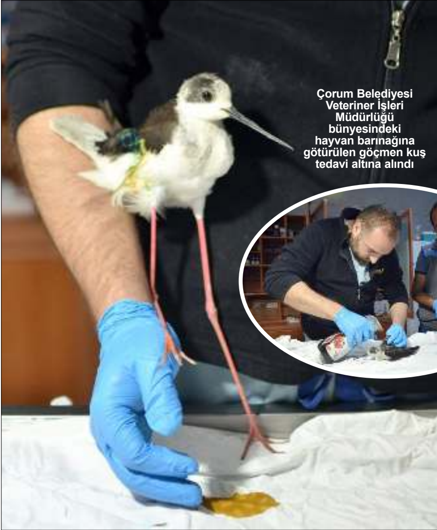
Çorum Belediyesi Veteriner İşleri Müdürlüğü bünyesindeki hayvan barınağına götürülen göçmen kuş tedavi altına alındı

Çorum'da bir sürücü tarafından yol kenarında yaralı halde bulunan bir göçmen kuş türü olan "uzunbacak" hayvan barınağına tedavi altına alındı.