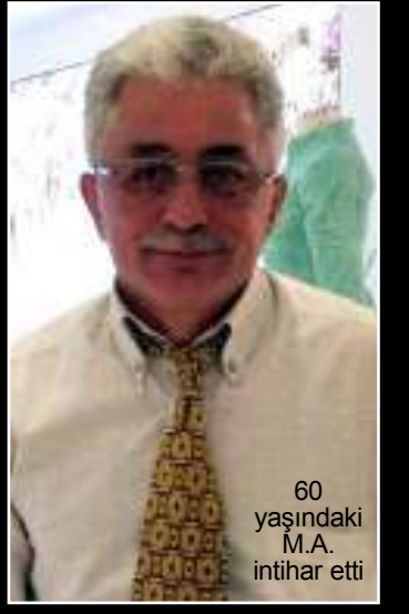
60 yaşındaki M.A. intihar etti

Yürüyüşe çıkmak için evinden ayrılan M.A.'dan bir süre sonra haber alamayan ailesi, piknik alanına gitti. Aile, M.A.'yı piknik alanında bulunan tuvalet içerisinde ipile tavana asılı halde buldu. İnar üzerine olay yerine 112 Acil Sağlık ve polis ekipleri sevk edildi. Sağlık ekipleri, yaptığı kontrolde M.A.'nın hayatını kaybettiğini belirledi. Olay yerinde yapılan inceleme neticesinde M.A.'nın cesedi, otopsi için Osmanlı Devlet Hastanesi morguna kaldırıldı. İntihar ettiği tespit edilen 2 çocuk babası M.A.'nın, bir süredir fizik tedavi gördüğü belirtildi. Polis, olayla ilgili soruşturma başlattı. (Haber Merkezi)