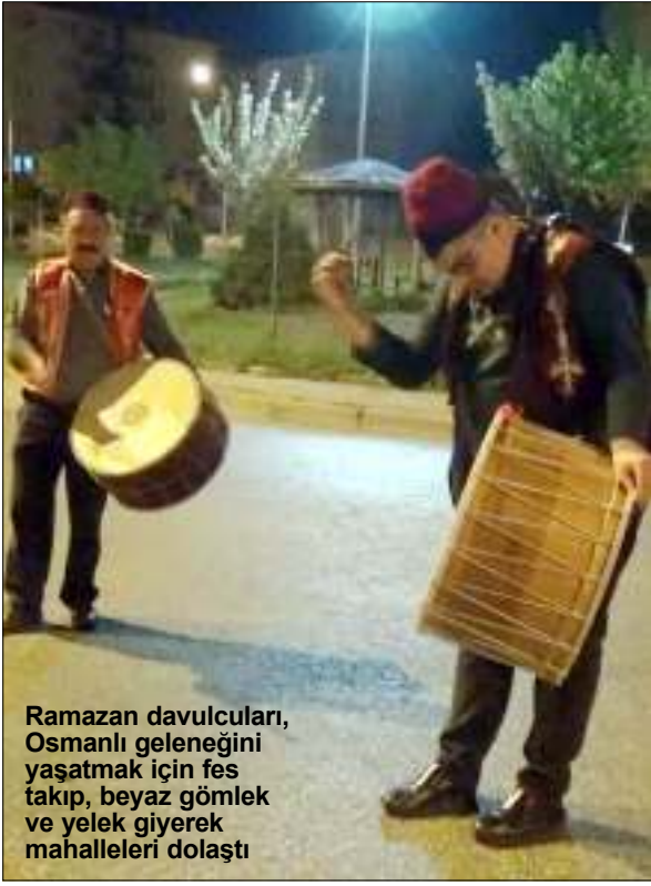
Ramazan davulcuları, Osmanlı geleneğini yaşatmak için fes takıp, beyaz gömlek ve yekek giyerek mahalleleri dolaştı

Çorum'da beyaz gömlek ve yekek giyen ramazan davulcuları, vatandaşları sahura Mehter Marşı ile kaldırıyor.