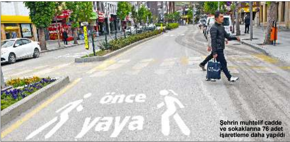
Şehrin muhtelif cadde ve sokaklarına 76 adet işaretleme daha yapıldı

Çorum Belediyesi yayaların ulaşımını kolaylaştırmak ve trafiği düzenlemek için çalışmalarına devam ediyor.