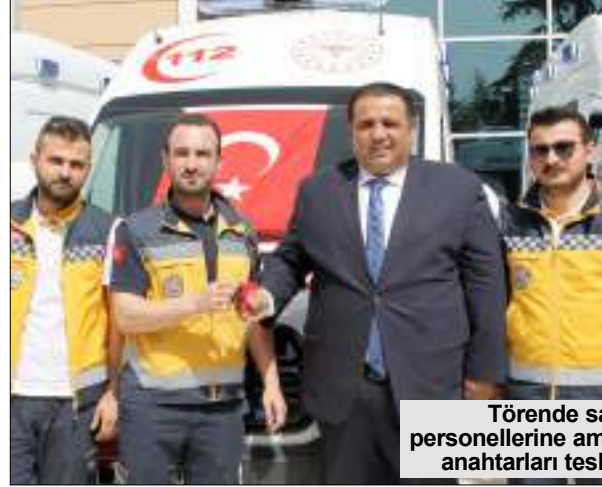
Törende sağlık personellerine ambulansların anahtarları teslim edildi