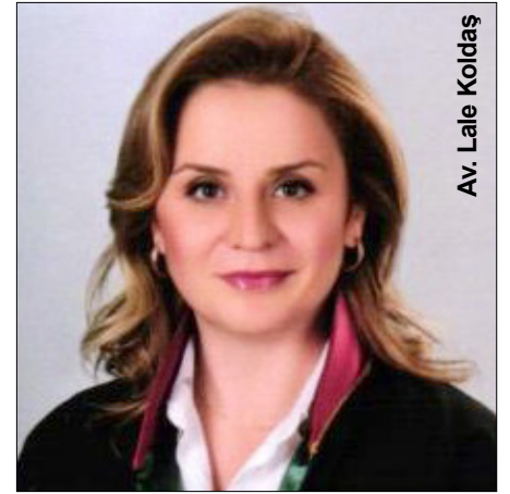
Av. Lale Koldaş