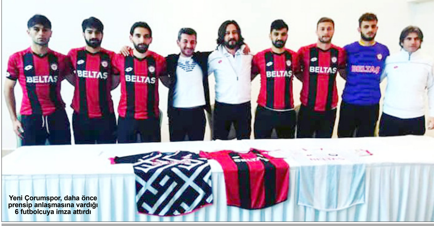
Yeni Çorumspor, daha önce prensip anlaşmasına vardığı 6 futbolcuyla imza attırdı