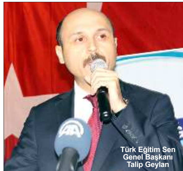
Türk Eğitim Sen Genel Başkanı Talip Geylan

özden Abonelik ve Siparişleriniz için www.ozdengazetesi.com.tr GAZETESİ VE YAYINLARI 0 212 518 23 97