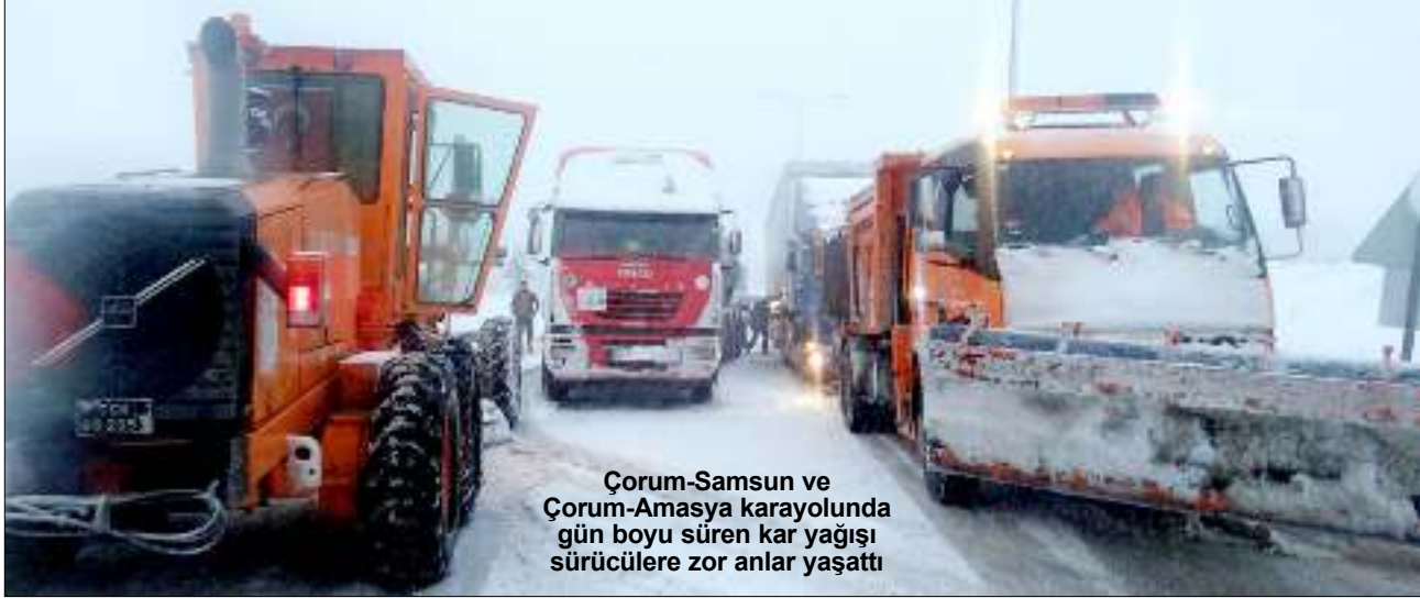
Çorum-Samsun ve Çorum-Amasya karayolunda gün boyu süren kar yağışı sürücülere zor anlar yaşattı

Çorum-Amasya karayolu tipi ve buzlanma nedeniyle ulaşım kapandı. Kar yağışı nedeniyle yolda kalan ve yoldan çıkan ağır tonajlı araçlar, yol tuzlama ve kar temizleme araçları tarafından bağlanan halatlarla yoldan çekildi. Yol yaklaşık 3 saatlik çalışmanın ardından ulaşım açıldı. Çorum-Samsun karayolunda ise trafik zaman zaman durma noktasına geldi. Meçhul Asker geçidinde kaza yapan araçlar ile yolda kalan ağır vasıtalar nedeniyle trafik kontrollü olarak verildi. (IHA)