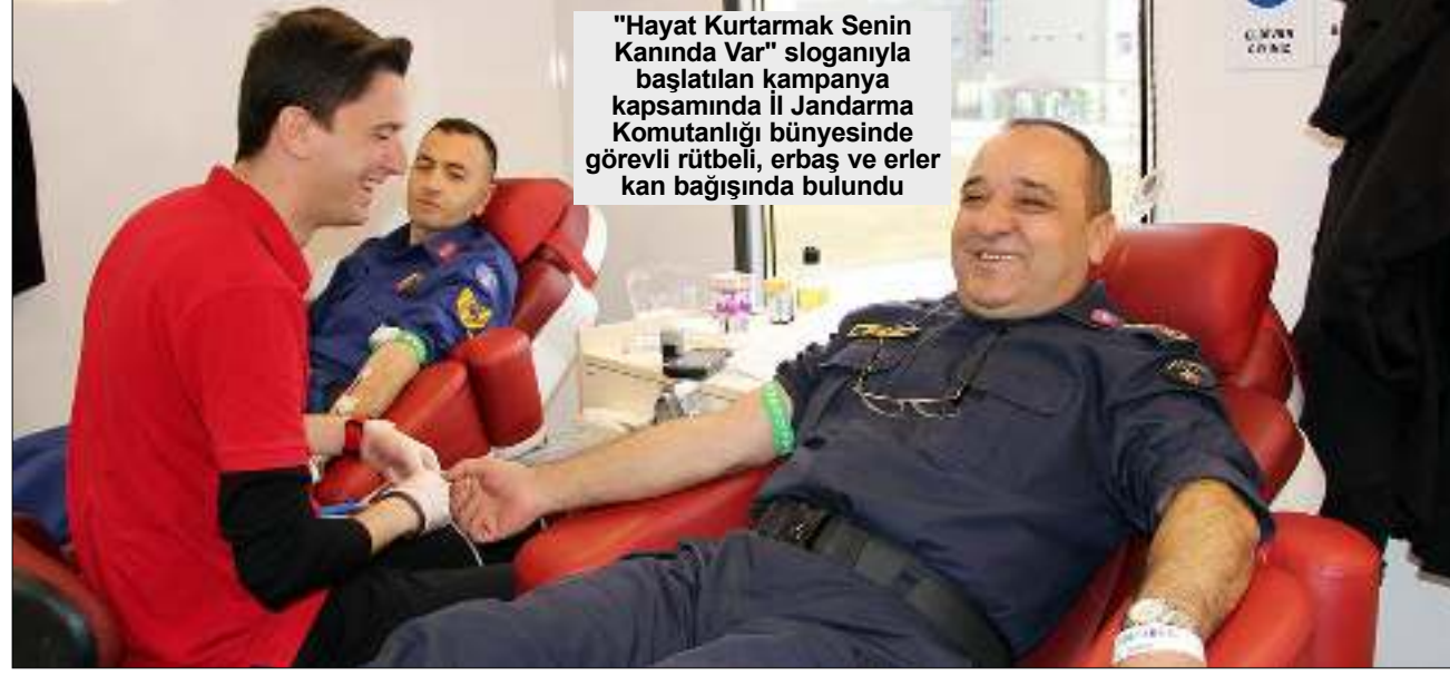
"Hayat Kurtarmak Senin Kanında Var" sloganıyla başlatılan kampanya kapsamında İl Jandarma Komutanlığı bünyesinde görevli rütbeli, erbaş ve erler kan bağışında bulundu