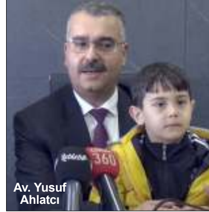
Av. Yusuf Ahlatcı

Cenneti annelerin ayakları altına seren bir insanın, kadını ve erkeği madalyonun iki yüzü gibi telakki eden bir medeniyetin